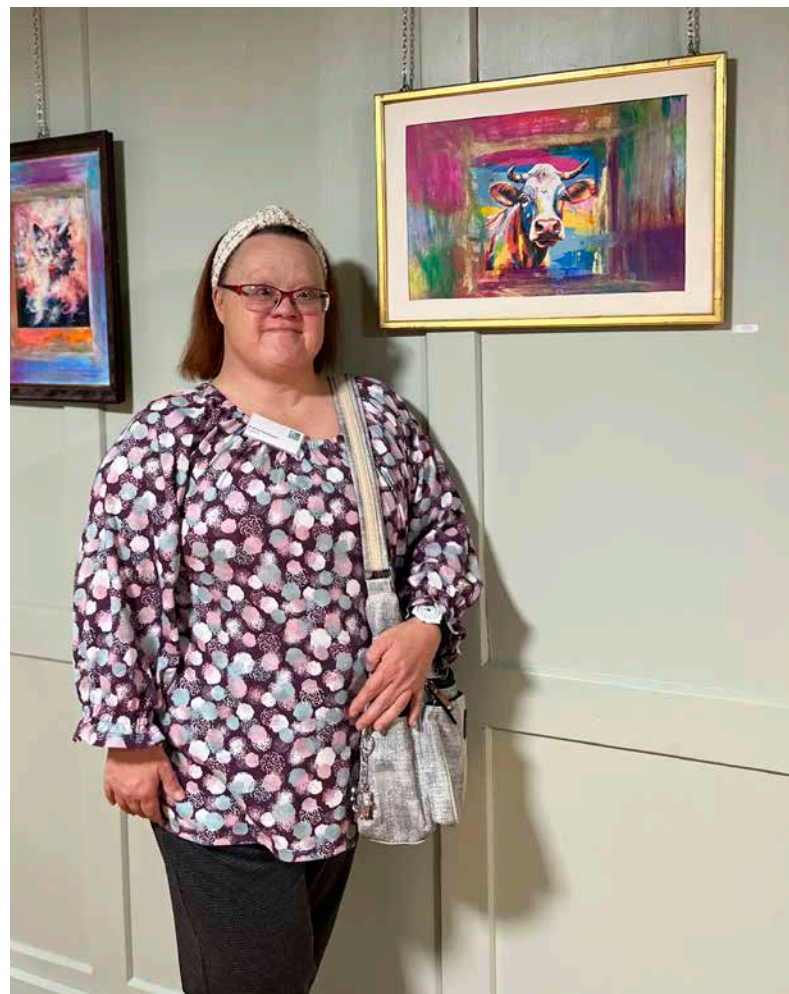
Kunstprojekt «Farbenfroh» im Kulturhaus Rössle, in Mauren