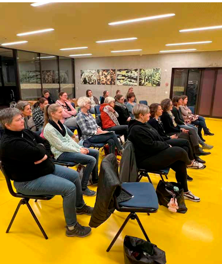
Regiotreff 2025 im Foyer, Im Kresta 2, Schaan