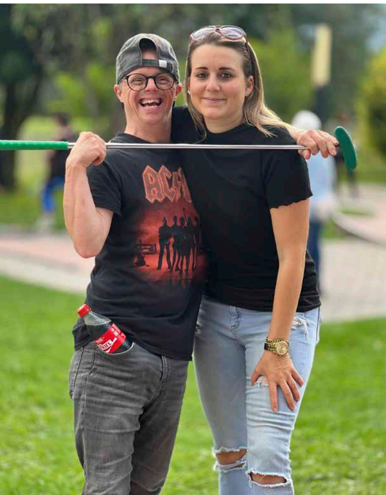
Minigolf in Vaduz