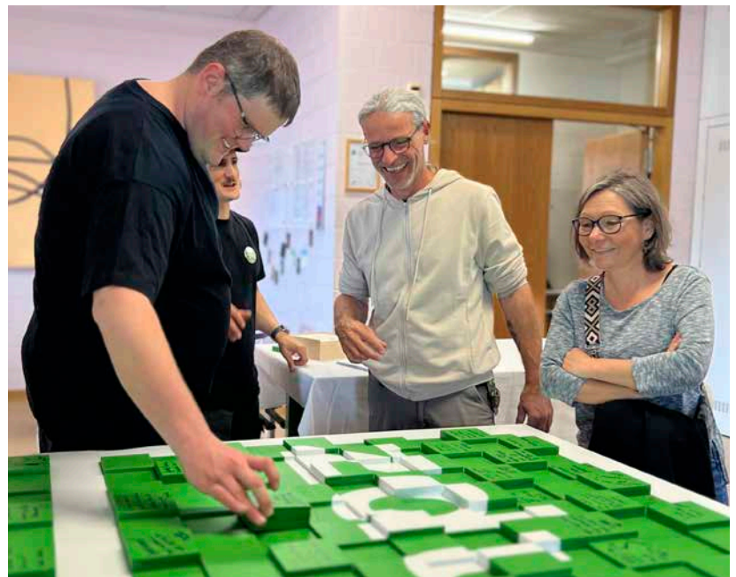
30-jähriges Bestehen der Abteilung Auxilia