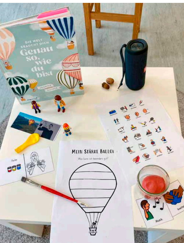
Ethik und Religionen

Die Einführung des Fachs hat positive Impulse für das soziale Miteinander an unserer Schule gesetzt. Die Schülerinnen und Schüler zeigen wachsendes Interesse an Fragen des Zusammenlebens und entwickeln zunehmend Empathie sowie Verständnis für andere Perspektiven.