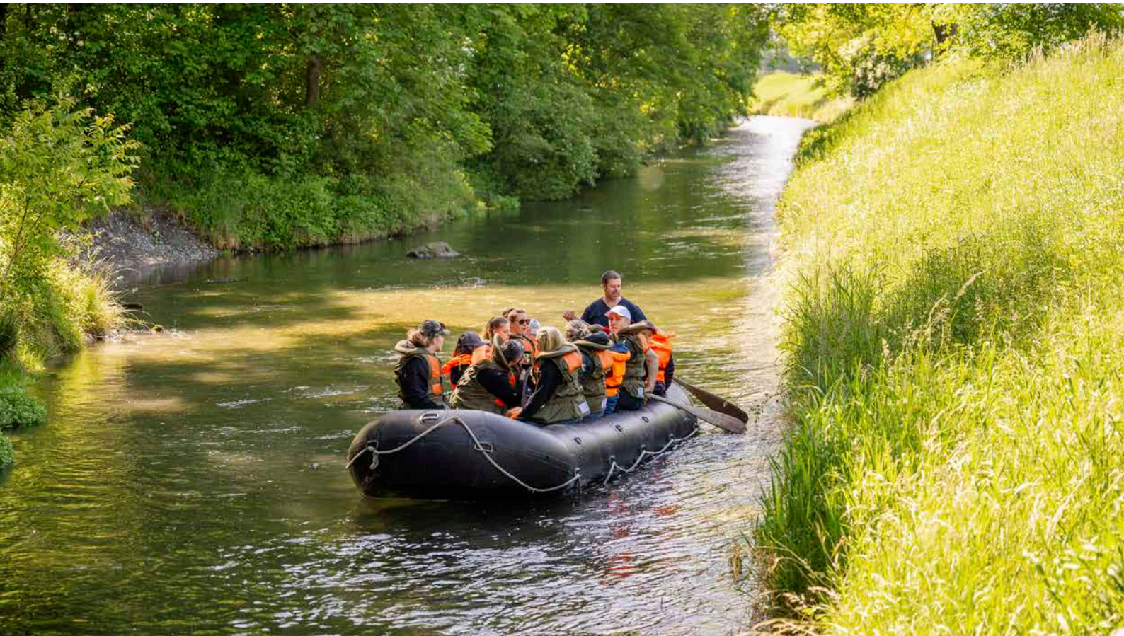
Bootsausflug auf dem Werdenberger Binnenkanal