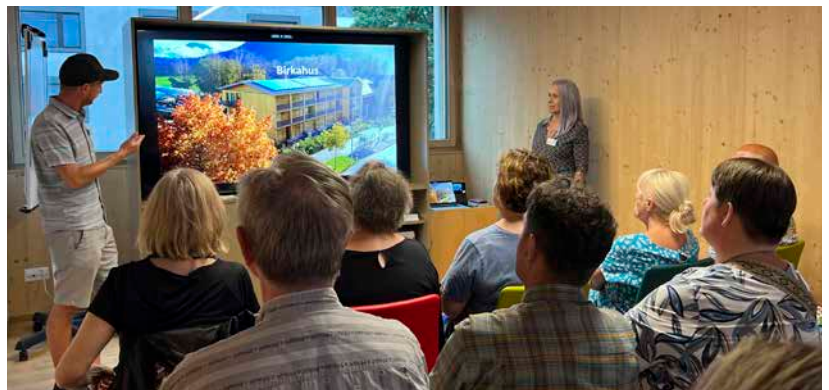
Regelmässige Treffen für Angehörige