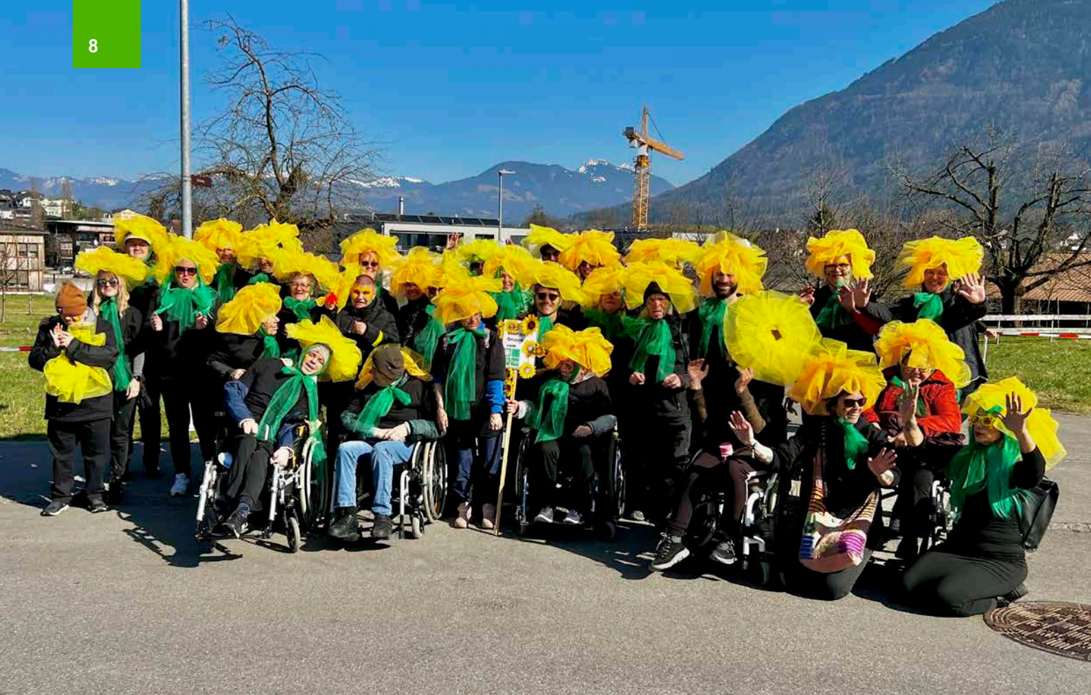
Murer Fasnachtsumzug 2025