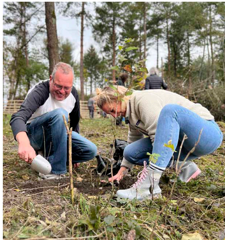
Baumpflanzaktion als Zeichen für nachhaltiges Wachstum