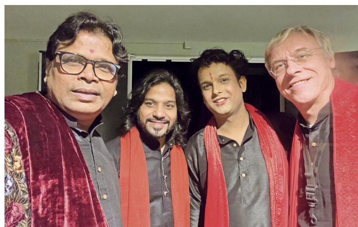
Culturall präsentiert Sufi-Musik und Tanz.