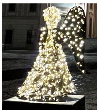
Kommt nach Schaan: Der Engel mit einem Flügel.

Das 2,3 Meter hohe, hell strahlende Denkmal ist eine Initiative des Vereins «Roll On Austria», der sich für eine Gesellschaft ohne Ausgrenzung und Berührungängste engagiert. Der Engel hat auf seiner internationalen Wanderschaft schon an mehreren Orten Halt gemacht, so etwa 2019 in Rom, wo er von Papst Franziskus gesegnet wurde, sowie vor fünf Jahren über Erbprinzessin Sophie auch im Gartenpalais Liechtenstein in