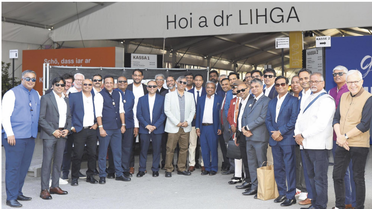
Die Gäste der Bombay Industries Association wurden durch die Messe geführt und zeigten sich vom Angebot und den Innovationen begeistert.