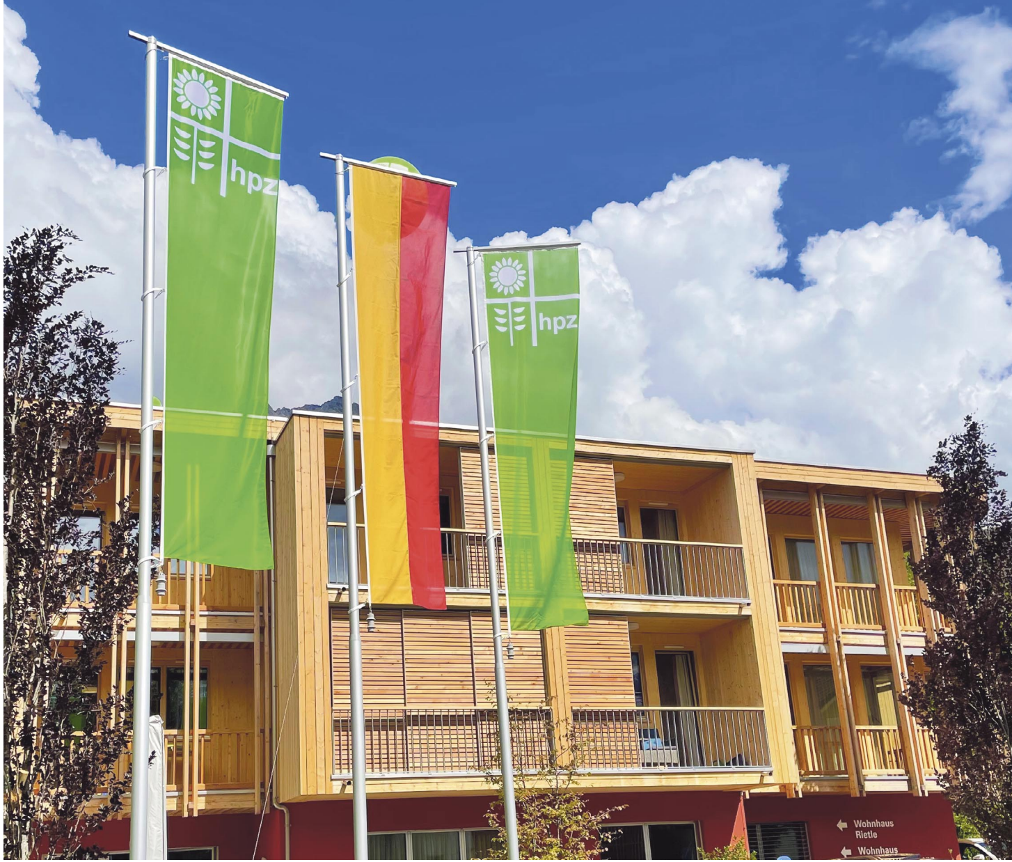
Mit den neuen Rietle-Wohnhäusern ist das HPZ künftig gut gerüstet.

In Schaan und Mauren werden insgesamt 57 Personen mit unterschiedlichsten Bedürfnissen von 70 Fachkräften und 14 Auszubildenden und Praktikantinnen und Praktikanten während 365 Tagen im Jahr gefördert, betreut und gepflegt. Die