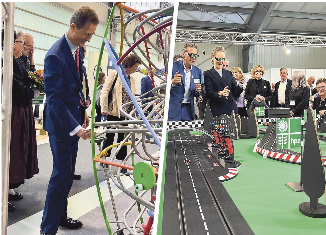
Der Lihga- Stand ist ein unglaublicher Publikumsmagnet und erfreut sich bei Gross und Klein einem enormen Zuspruch.

An seinem attraktiven Stand zeigt das HPZ seine beeindruckende Vielfalt und bietet mit einer XXL-Kugelbahn sowie der riesigen Rennbahn zwei absolute Attraktionen. Die Rennbahn vermittelt mit den Ampel-Startlichtern und der Zeitmessung echtes Formel-1-Feeling. Nicht selten steigen über die Renndistanz von zehn Runden innerfamiliäre Zweier-Duelle – manchmal mit überraschendem Ausgang. So hat sich etwa gezeigt, dass Mädchen oft feinfühlicher und damit auch erfolgreicher fahren als Jungs. Heute geht es zwischen 14 und