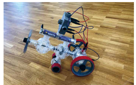
Flugzeug aus Styropor

Wir haben ein Flugzeug aus Styropor gebaut. Wir haben über Einiges gesprochen. Am besten hat mir gefallen, das Flugzeug zu bauen.