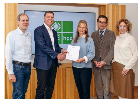
Der unterzeichnete Baurechtsvertrag zwischen der Gemeinde Mauren und der Fürstin Gina von Liechtenstein Stiftung