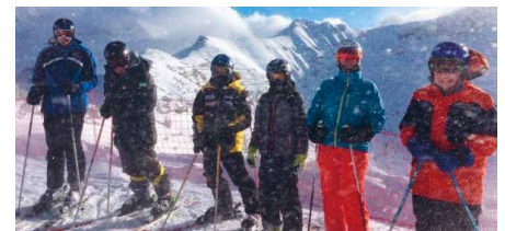
Skifahren bei windigen Verhältnissen