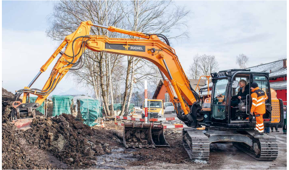
Prinzessin Tatjana sass beim Spatenstich nach der Vertragsunterzeichnung selbst am Steuer

Das Projekt Neubau «Birkahus» wurde dringend nötig, da die heutigen