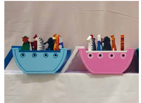
Arche Noah aus Holz