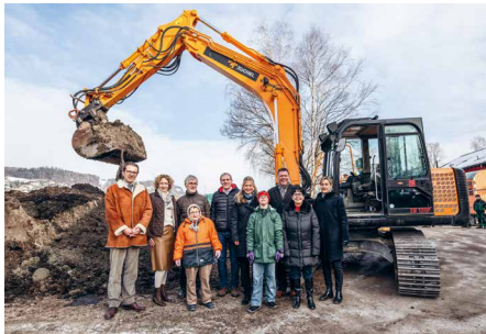
Startschuss für den Neubau «Birkahus» in Mauren