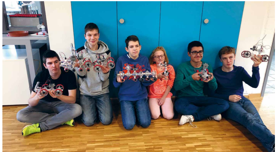
Schüler und Schülerinnen zeigen ihre Experimente

feln gebaut. Mir hat es am besten gefallen, einen Turm aus Würfel zu bauen. Ich würde gerne nochmal hingehen, weil ich es cool und interessant fand.