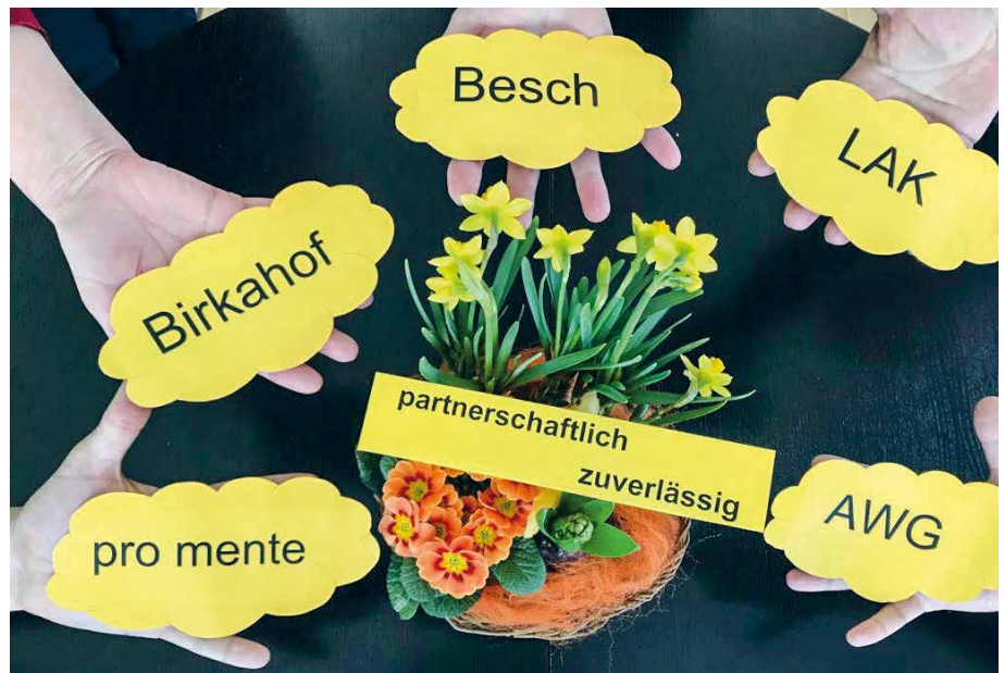
Zusammensein in vertrauter Atmosphäre

Im Wesentlichen war bei allen Rückmeldungen eines auffallend: Es wurde laut darüber nachgedacht wie, weit im Alltag oftmals durch Gewohnheiten oder durch gemachte Erfahrungen manchen Bewohner/innen zu wenig zugetraut wird. Gewisse Handlungen im Alltag zeigten, dass trotz des Altersfortschrittes oder des Grades der Beeinträchtigung noch