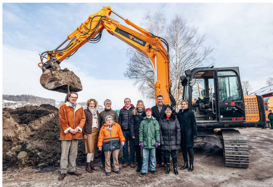
Projektbeteiligten beim Spatenstich

Das heutige, alte Gebäude wird in einer zweiten Etappe renoviert. Einige Wohneinheiten bleiben erhalten und werden barrierefrei umgebaut. Neu entstehen Wirtschaftsräume für die betreuten Mitarbeitenden der Hauswirtschaft sowie Räumlichkeiten für Therapie, Verwaltung und Administration. Der Neubau wird voraussichtlich Anfang 2020 bezugsbereit sein.