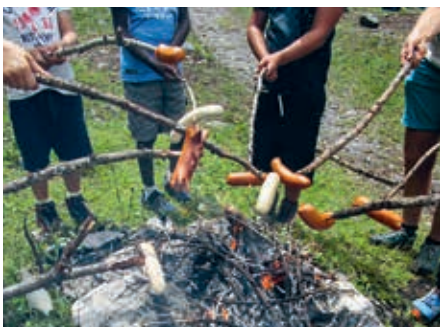
Mittagessen im Sertigtal

Am Dienstag fuhren wir ins Sertigtal und wanderten am Bach entlang zum Wasserfall. Für das Mittagessen machten wir ein Feuer, schnitzten Stöcke und grillten feine Bratwürste.