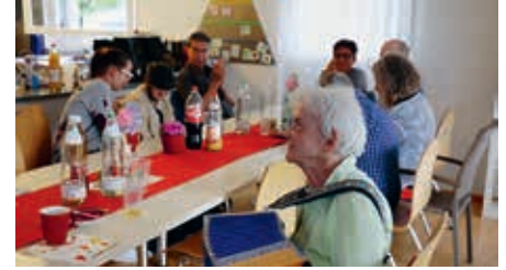
Ausgelassene Stimmung unter den Teilnehmenden

Ein herzliches Dankeschön möchte ich im Namen des Wohnhauses Besch ab-