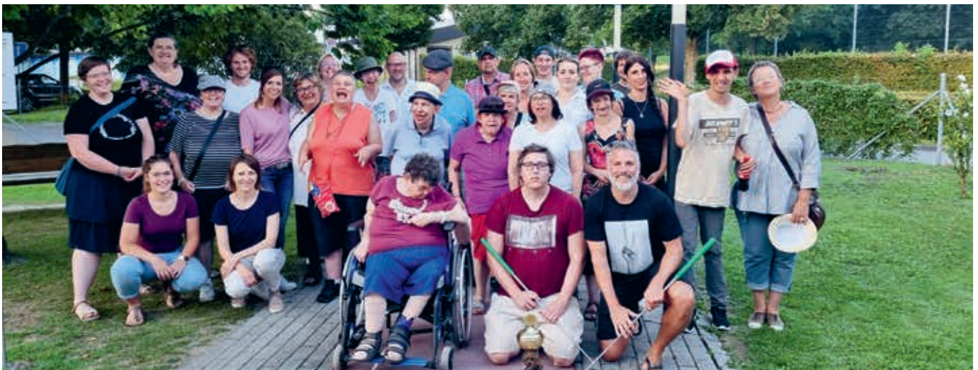
Gruppenbild der hpz Minigolf Mannschaft

Am Montag den 08.08.2022 nachmittags trafen sich das Vaduzer Medienhaus und das hpz Wohnen wieder einmal zur mittlerweile lieb gewonnen, traditionellen Minigolf-Challenge in Vaduz. Getreu dem Motto «Es ist uns eine Freude, dabei sein zu dürfen», gaben