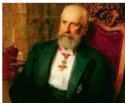
Fürst Johann II (1858 – 1929)

Die historisch-politische Führung begann im Fürst-Franz Josef-Saal. Anhand der Gemälde der Fürsten erzählte Leander die geschichtlichen Hintergründe sowie die taktischen Handlungen und Zufälle, welche zur Entstehung von Liechtenstein führten. Was für eine Rolle Napoleon dabei spielte und wie das ehemalige Reichsfürstentum zu einem souveränen Kleinstaat wurde. So z.B. wurde der Name Liechtenstein erstmals um das Jahr 1136 erwähnt. Die konstitutionelle Verfassung gab Fürst Johann der II im Jahre 1862 und