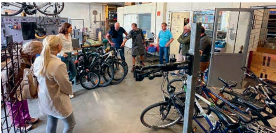
Besichtigung der Schlossrei