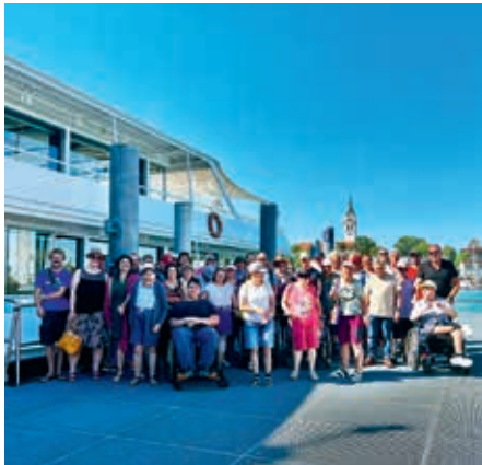
Gruppenfoto Schifffahrt über den Bodensee