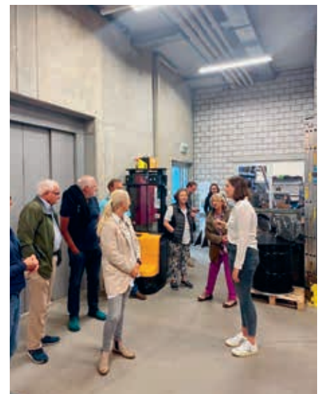
Besichtigung der Auxilia