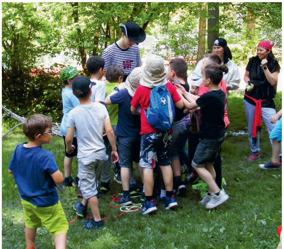
Der Schatz wird aufgeteilt