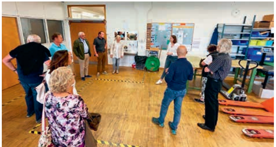
Rundgang durch die Auxilia

Beim Rundgang konnten die Mitglieder einen Einblick gewinnen, mit welchem Elan und Fleiss die Betreuten bei der Arbeit sind und mit welcher Präzision die Arbeiten ausgeführt werden.