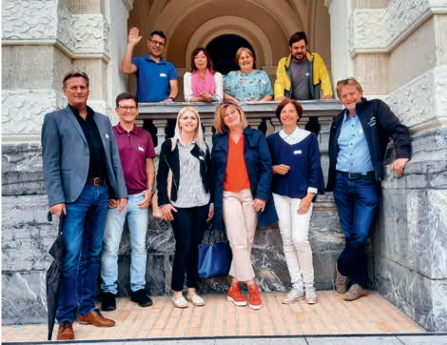
Auch für das bisschen Regen waren wir gewappnet

Der 1. Juni 2022 war nicht ein üblicher Arbeitsalltag für die Mitarbeitenden der Verwaltung. Anlässlich eines Teamtages nutzten wir diesen Mittwoch-Nachmittag, um uns in einer lockeren und freizeithlichen Atmosphäre auszutauschen und näher kennenzulernen. Kennenzulernen? Seit anfangs Jahr sind vier neue Mitarbeitende – inzwischen für viele vom hpz bereits bekannte Stimmen oder Gesichter – an Bord: