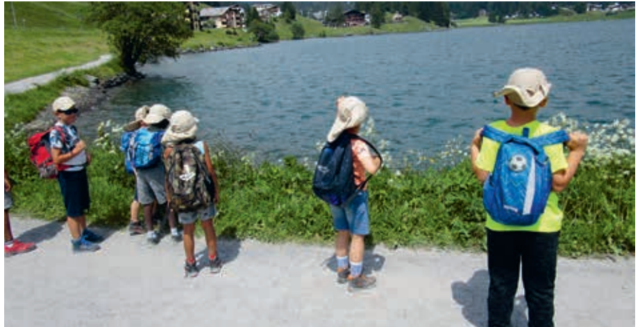
Wanderung um den Davoser See

Am Nachmittag fuhren wir mit der Gondel auf das Rinerhorn und eroberten am Berg den tollen Spielplatz. Bei unserer Ankunft im Tal war die Hauptstrasse gesperrt und das Radrennen «Tour de Suisse» der Damen sauste an uns vorbei, sodass wir natürlich die Sportlerinnen fest anfeuerten. Am Mittwoch regnete es stark, aber dies hielt uns nicht davon ab, auf die Schatzalp zu fahren. Wasserfest angezogen fuhren wir mit dem Schrägaufzug den Berg hinauf und wanderten über die Promenade zurück ins Tal. Die riesengrosse Portion Pommes zu Mittag schmeckte an diesem Tag doppelt so gut. Auf den Nachmittag freuten sich die Kinder bereits im Vorfeld ganz besonders, denn wir besuchten das Eau-la-la, ein Erlebnishallenbad mit einer tollen Rutschbahn. Alle wagten sich mutig die Rutschbahn hinunter. Am Donnerstag stand der Zwergenwald in Klosters auf