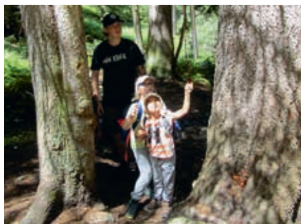
Auf der Feenwiese

Am Nachmittag fuhren wir mit der Gondel auf das Rinerhorn und eroberten am Berg den tollen Spielplatz. Bei unserer Ankunft im Tal war die Hauptstrasse gesperrt und das Radrennen «Tour de Suisse» der Damen sauste an uns vorbei, sodass wir natürlich die Sportlerinnen fest anfeuerten. Am Mittwoch regnete es stark, aber dies hielt uns nicht davon ab, auf die Schatzalp zu fahren. Wasserfest angezogen fuhren wir mit dem Schrägaufzug den Berg hinauf und wanderten über die Promenade zurück ins Tal. Die riesengrosse Portion Pommes zu Mittag schmeckte an diesem Tag doppelt so gut. Auf den Nachmittag freuten sich die Kinder bereits im Vorfeld ganz besonders, denn wir besuchten das Eau-la-la, ein Erlebnishallenbad mit einer tollen Rutschbahn. Alle wagten sich mutig die Rutschbahn hinunter. Am Donnerstag stand der Zwergenwald in Klosters auf