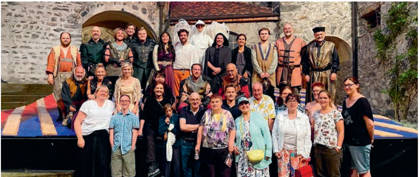
Gruppenfoto mit den Akteuren auf Burg Gutenberg