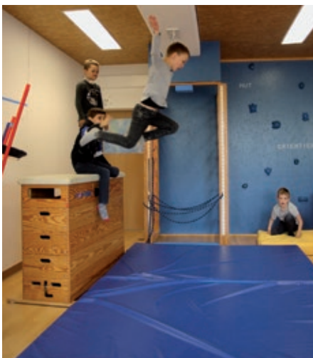
Sprung aus den Wolken