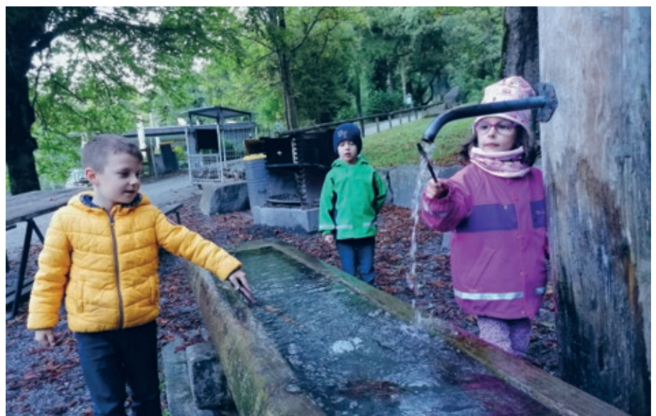
Erleben und Entdecken