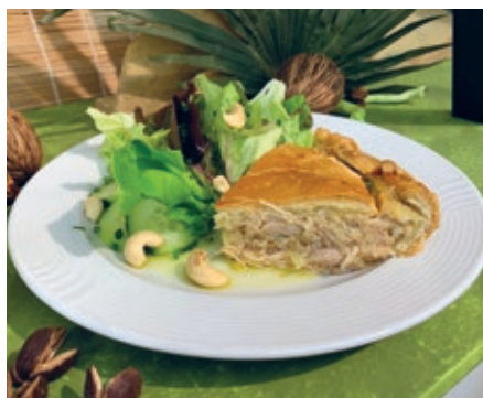
Brasilianische Pastete mit Huhn und Salat

Als vegetarische Hauptspeise gab es Süsskartoffelgnocchi mit Salbeibutter. Am Dienstag wurde der Blattsalat mit Orangen garniert und zur Hauptspeise gab es Bohneneintopf mit Rindfleisch oder buntem Gemüse. Mittwochs wurden die Gäste verwöhnt mit zweierlei Maissalat und gebratenem Schweinerücken mit Ananas, Chili und Kartoffel oder mit gemischtem Grillgemüse mit Ziegenkäse und Kartoffel. Zum Abschluss der Woche gab es Süsskartoffelsuppe als Starter mit brasilianischem Fischeintopf oder gebackenem Maniok mit Gemüse und Reis.