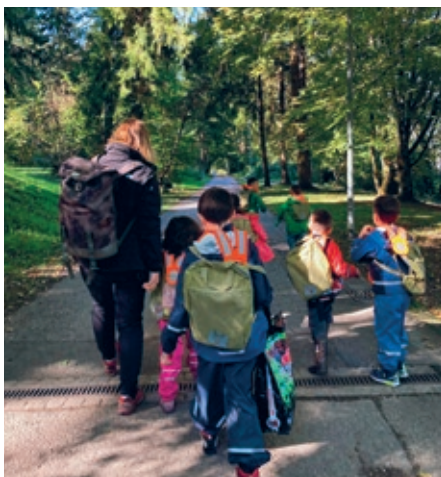
Auf dem Weg in den Duxwald