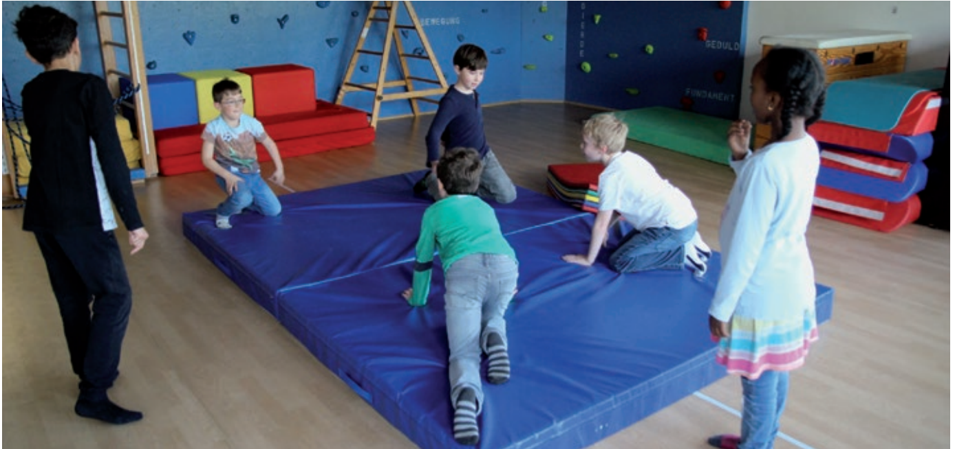
Absprache vor dem Kampf