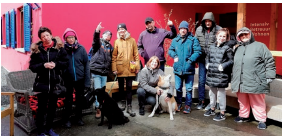
Gemeinsamer Einsatz vor dem Birkahus