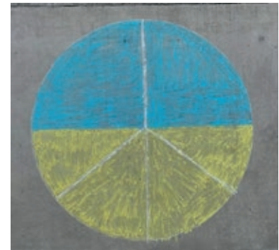
Das Peace-Zeichen ist ein starkes Symbol