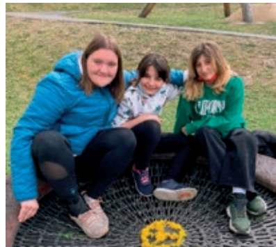
Wir sind für den Frieden