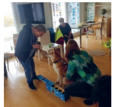
Aika im Einsatz mit der Schnüffel-Box