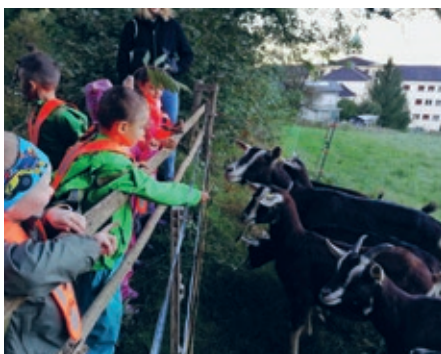
Die Ziegen freuen sich über unseren Besuch

Der Weg ist das Ziel! Und so warten schon während des Weges in den Duxwald erste Highlights auf die Kinder. Die Glöckchen der Ziegen kann man schon von weitem hören. Sie freuen sich immer über einen Besuch.