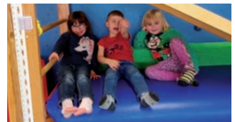
Pausen sind wichtig