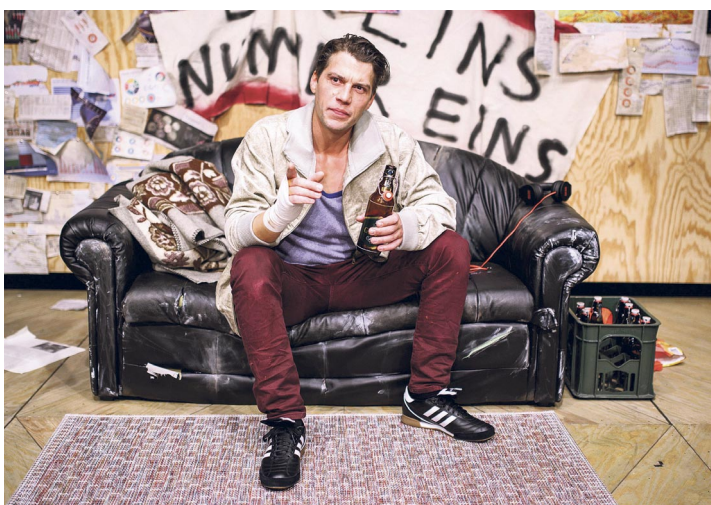
Das deutsche Nationaltheater Weimar zeigt «Ich liebe Dir».