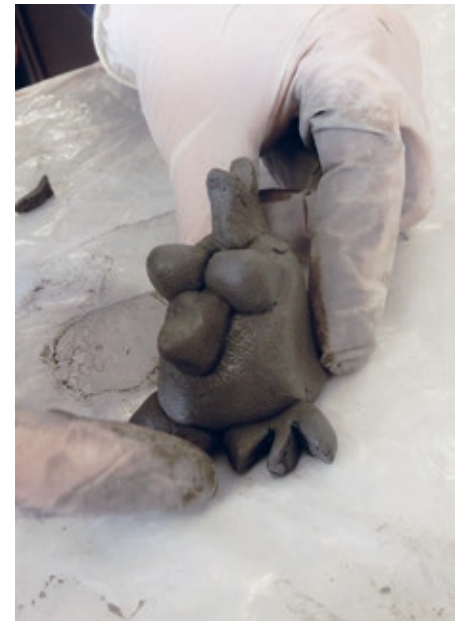
Huhn ist fertig modelliert

Bei der Ideenentwicklung setzt das Atelier auf Teamwork. Zunächst werden zum Thema «Produkte für den Frühling» zahlreiche Ideen in der Gruppe gesammelt. Es geht dabei um die Entwicklung neuer, aber auch altbewährter Produkte. Die diesjährige Frühlingsproduktentwicklung brachte folgende Ideen: z.B. Eier aus Beton, Tonhasen, Frühlingsstecker aus Holz, Betonhühner und viele weitere Vorschläge.