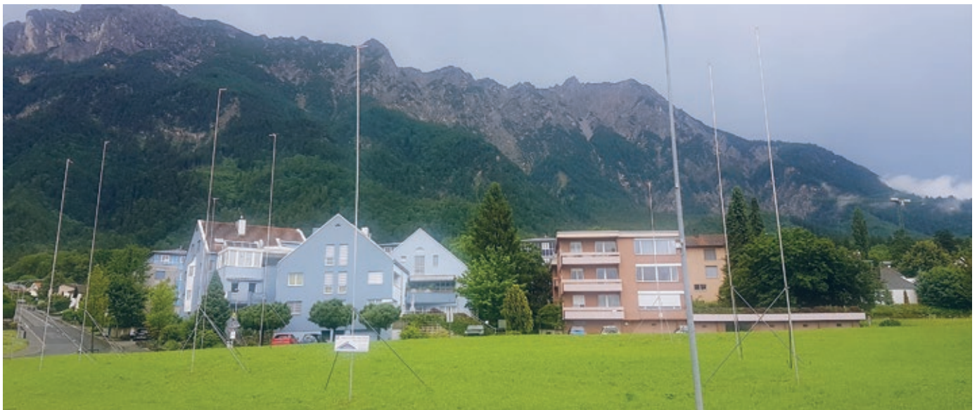
Visiere sind aufgestellt