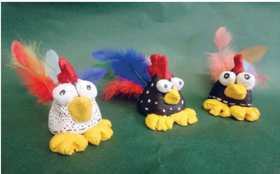
Die fertigen «verrückten Hühner»