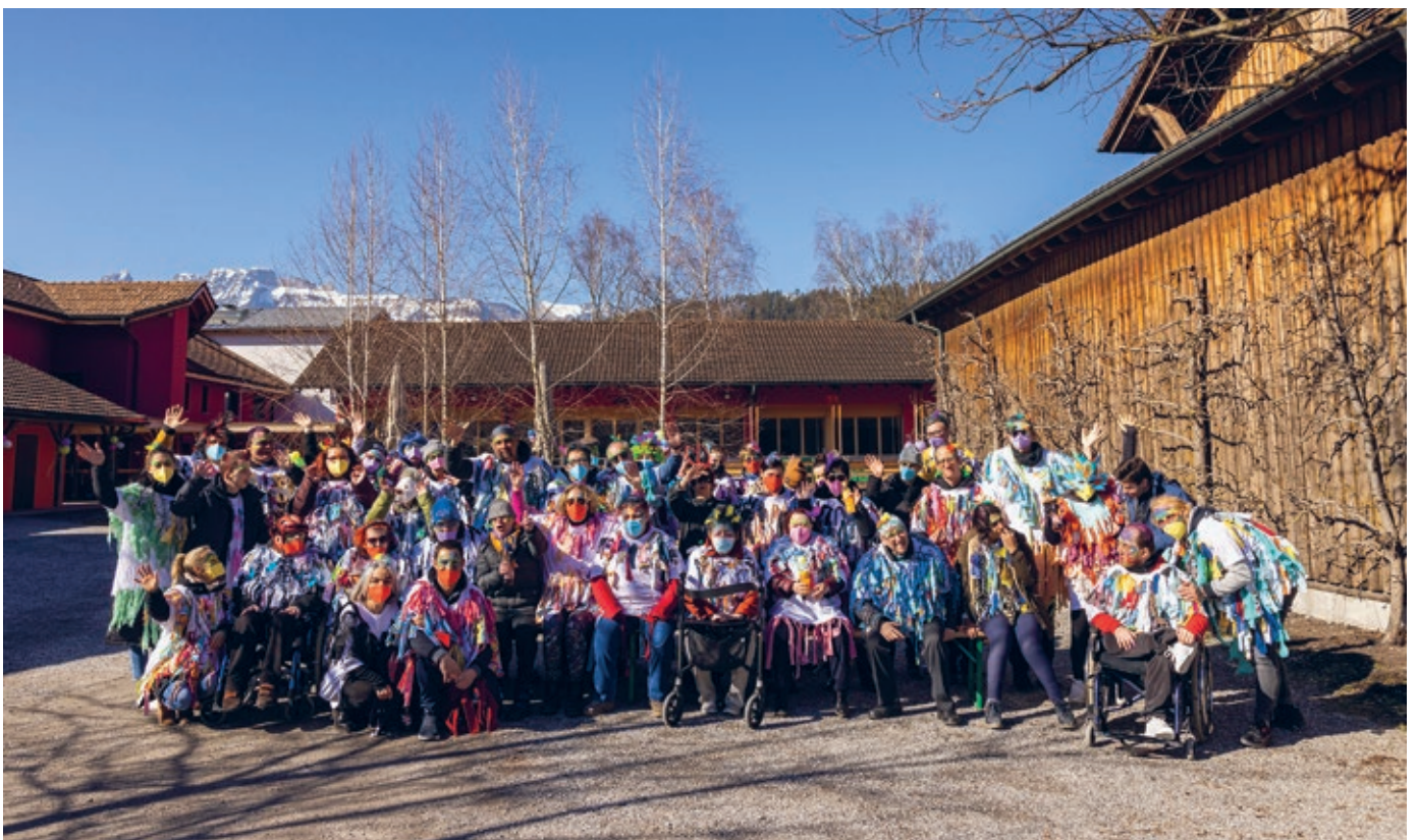
Die bunten Vögel des hpz