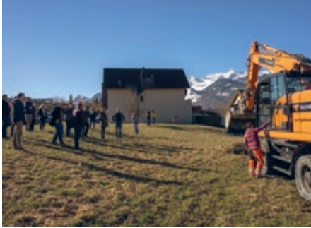
Versammlung zum Spatenstich