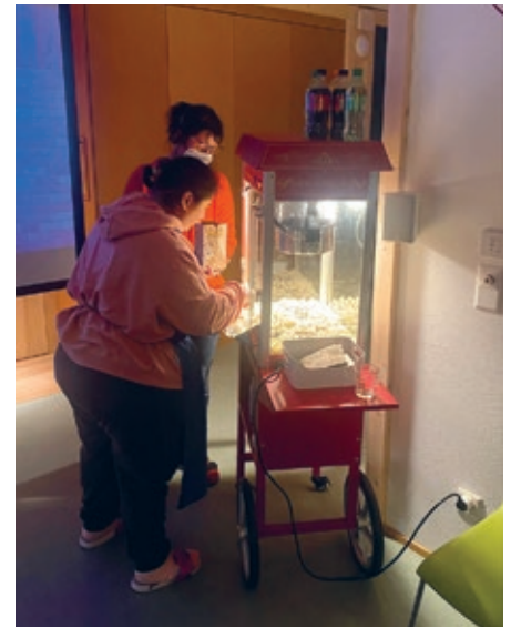
Popcorn darf nicht fehlen