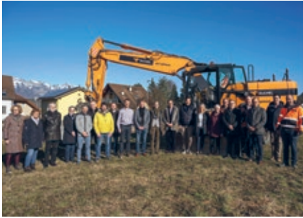
Spatenstich der neue Protekta in Schaan