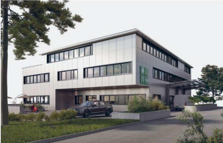
Visualisierung der neuen Protekta