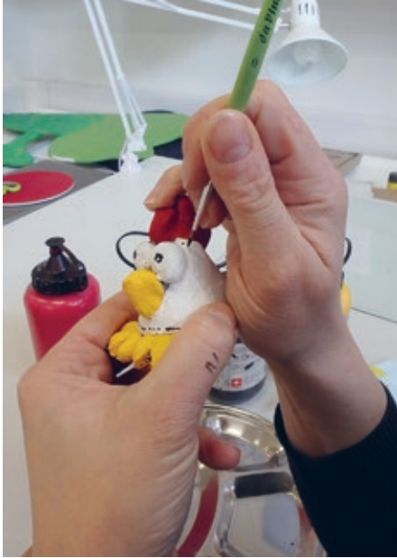
Bemalen des Huhnes