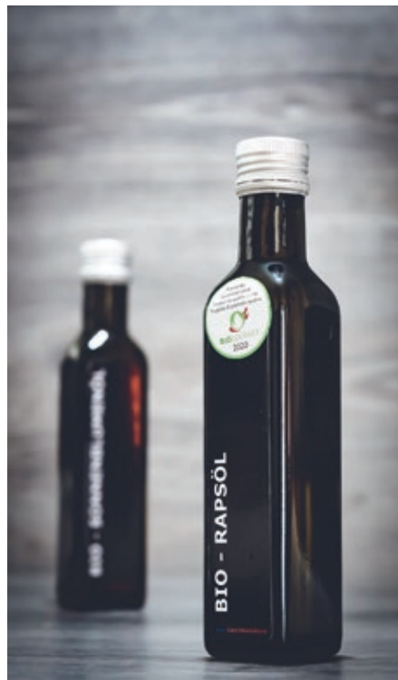
Rapsölfflasche für den Verkauf im Hoflädile Agra, hpz-Laden Schaan und in ausgewählten Hofläden in FL