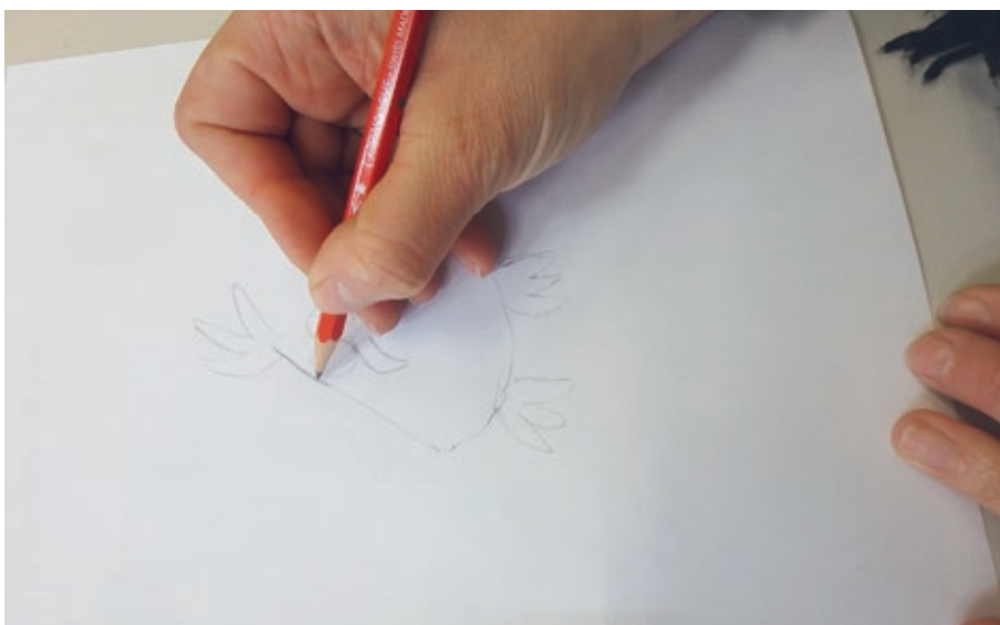
Erste Skizze entsteht