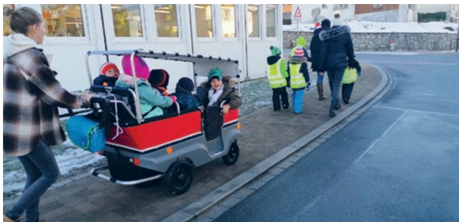
Unsere erste Ausfahrt mit der Kutsche