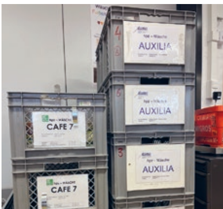
Kisten nach Abteilung sortiert