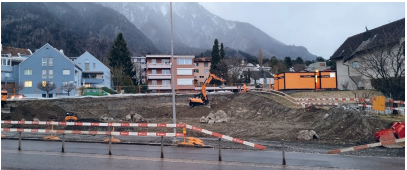
Der Aushub ist gemacht