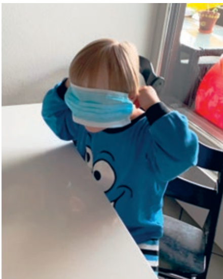
Maske aufsetzen braucht Übung