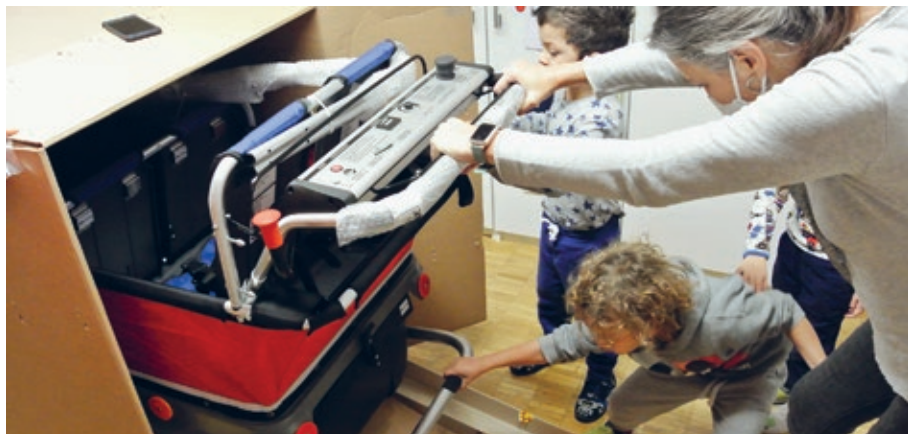
Wir packen unser riesengrosses Geschenk aus

Dank einer Spende wurde uns viel geschenkt. Die neue Kutsche bedeutet für uns: