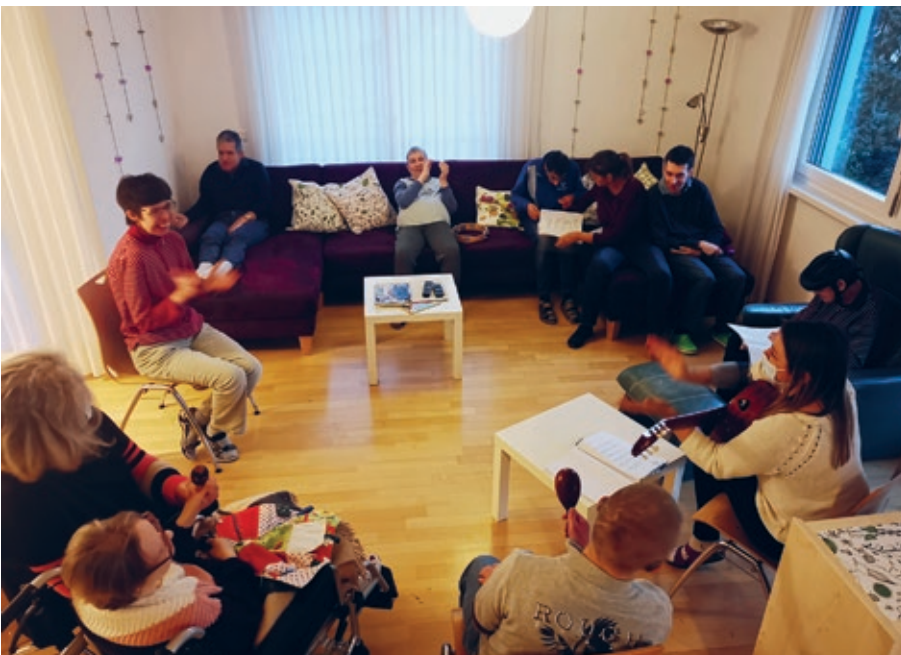
Singen in der Gruppe macht soviel Spass