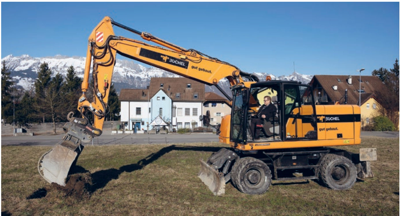
Baustart der neuen Protekta am 10.02.2022

Bei der Bauherrin der neuen Werkstätte handelt es sich um die FMR Stiftung aus Schaan, welche sich zum Ziel gesetzt hat, Institutionen im sozialen Bereich zu unterstützen. Gemeinsam mit uns konnte das Projekt «Neubau Protekta» ins Leben gerufen werden. Für den Stiftungsrat der FMR Stiftung ist dieser Neubau genau im Sinne der Stifterin und des Stifters: «Wir sind von der Arbeit des hpz und seinem grossen Einsatz für Menschen mit Behinderungen mehr als überzeugt und freuen uns zusammen mit dem hpz den Stiftungszweck vollumfänglich umsetzen zu können» . Genauso erfreut über das Grossprojekt ist unser Planungsteam: