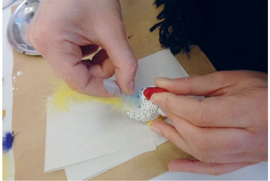
Das Huhn wird mit Federn geschmückt

Die Arbeit mit Knetbeton ist neu. Daher mussten wir uns zunächst mit dem Material und seiner Bearbeitung vertraut machen. Knetbeton ist knetbar wie Brotteig, komplett wetterfest und wird steinhart. Die Hühner können somit bei Wind und Wetter problemlos im Aussehbereich eingesetzt werden. Das