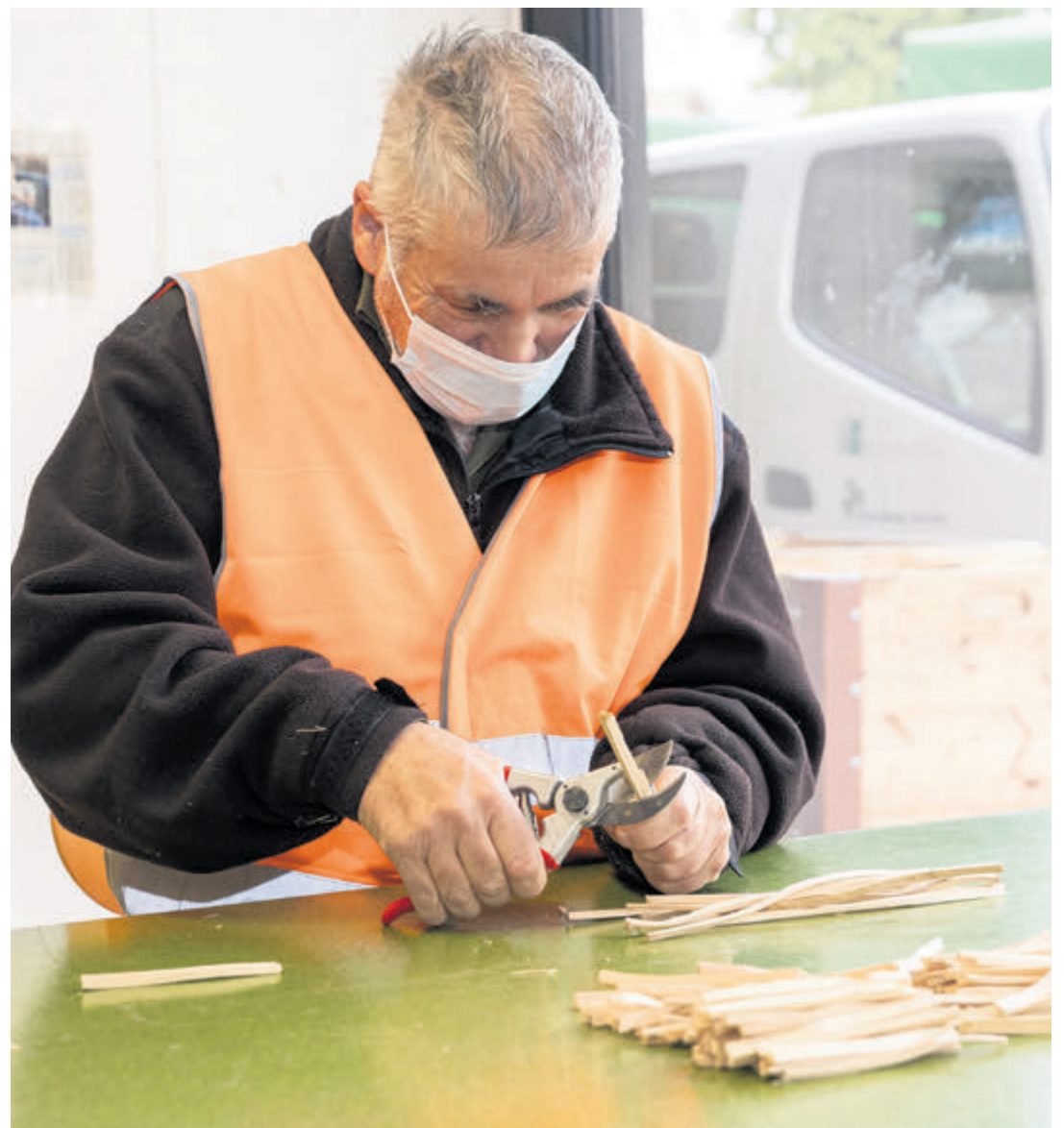
Die Mitarbeiter der HPZ-Werkstätten freuen sich über viel Arbeit.