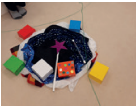
Theorieteil mit Vorführung verschiedener Brennmaterialien