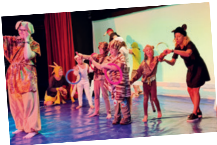
Die wilden Tiere im Zirkus