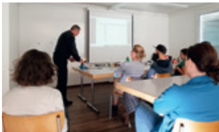
Theorieteil mit Vorführung verschiedener Brennmaterialien

Die Schulung dauerte jeweils rund 2½ Stunden und wurde in einen theoretischen