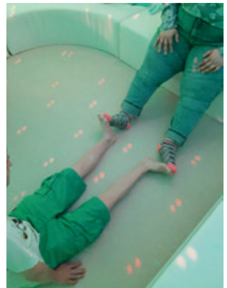
Tanz- und Bewegung

Der Snoezelraum im hpz ist ein wahres Wunderland. Auf den ersten Blick ist es «nur» ein weisser Raum mit Polsterliegeflächen und einem Wasserbett. Aber mit verschiedensten Mitteln haben wir die Möglichkeit, diverse Reize hinzuzufügen. So können wir z.B. Wassersäulen, eine Spiegelkugel, Flüssigkeitsdials oder einen Lichterteppich in unterschiedlichen Farben hinzuschalten und dadurch Effekte erzielen. Ebenso nutzen wir Düfte, Klänge und verschiedenste Geräte zur Entspannungsmassage. In der Regel entscheiden wir uns im Voraus für ein Thema, welches wir dann so umsetzen, dass wir verschiedene Sinne ansprechen. Unsere erste Snoezeleinheit hat uns einen Ausflug in den Wald beschert. Nachdem sich alle im Raum einen Platz gesucht und sich