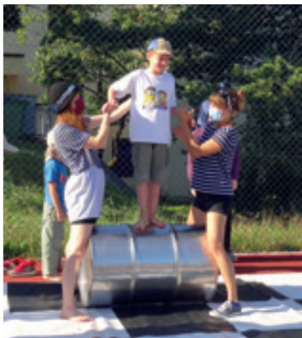
Hier wird fleissig geübt