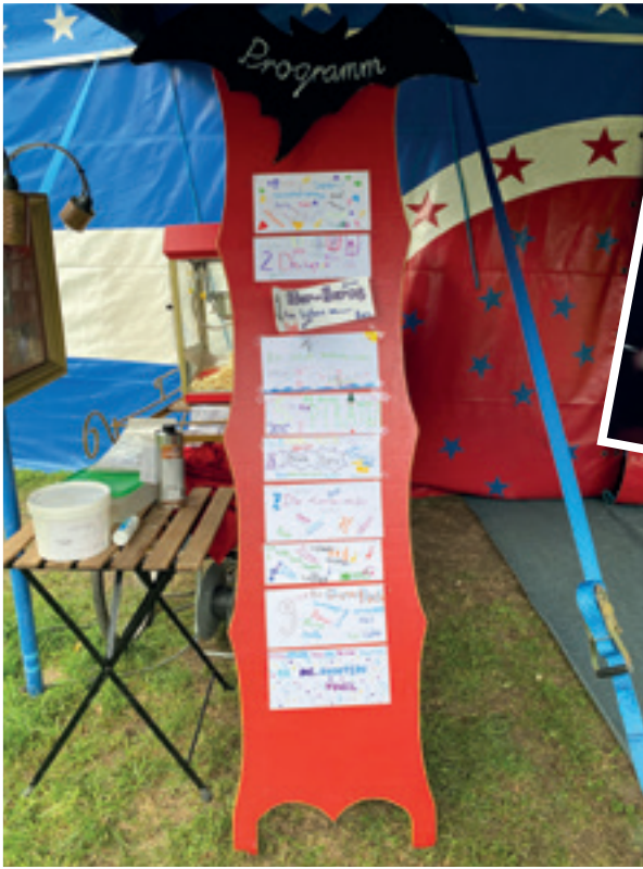
Das abwechslungsreiche Zirkusprogramm