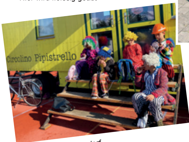
Die Clowns im Zirkusdorf