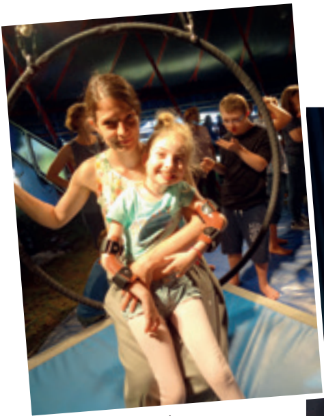
Summer im Luftring