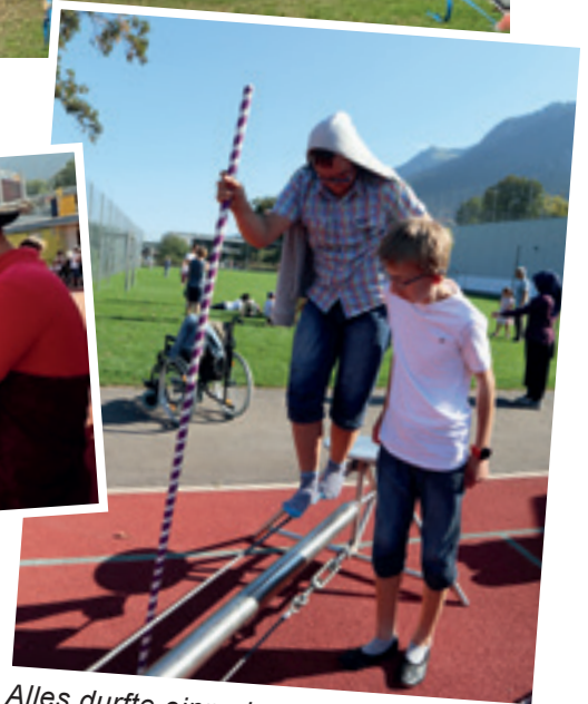
Alles durfte einmal ausprobiert werden