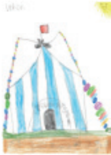
Zeichnung von Ledion