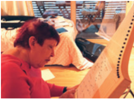
Veeh-Harfe beruhigt mit ihren sanften Töne

Die Veeh-Harfe ist ein Zupfinstrument, welches ohne Notenkenntnisse gespielt werden kann. Durch die Kreise und Punkte, die auf Schablonen für die Veeh-Harfen speziell angefertigt wurden, entstehen die unterschiedlichsten Melodien. Bekannte Lieder aus Kinderzeiten lösen bei unseren Bewohnerinnen und Bewohner eine gewisse Ver-