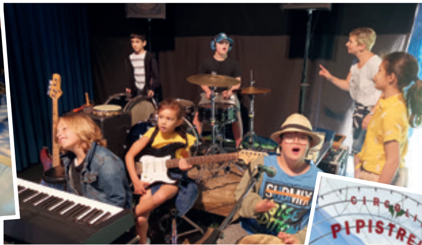
Die Musikanten erfreuten das Publikum