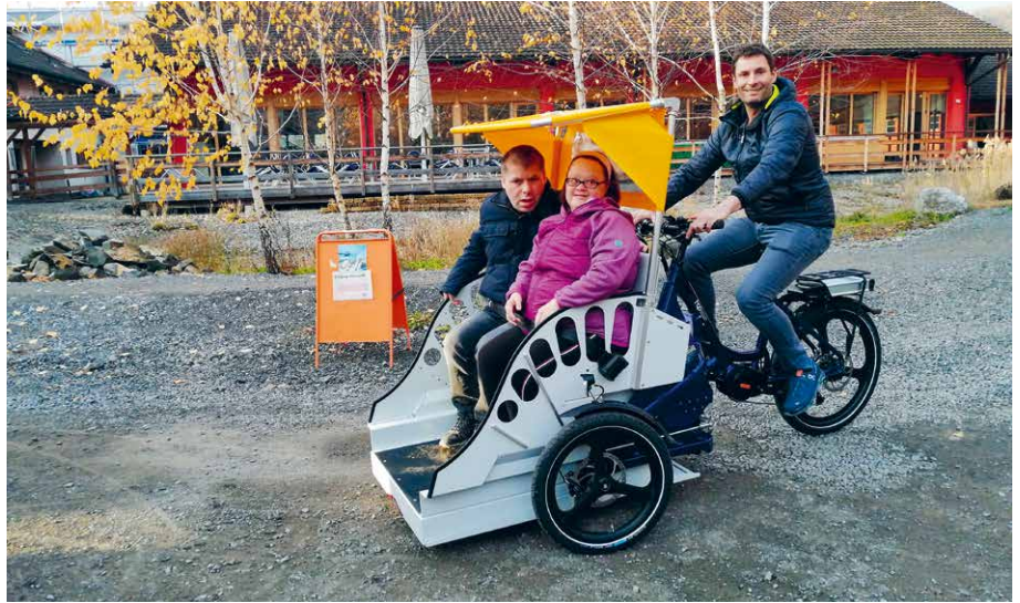
Erste Fahrversuche mit dem eTribike

Für viele Bewohnerinnen und Bewohner ist es eine völlig neue Möglichkeit, sich bequem fortzubewegen und zugleich die Natur wahrzunehmen. Da die Betreuungsperson als Fahrer in unmittelbarer Nähe ist, können auch Menschen mit schwereren Beeinträchtigungen ungefährlich transportiert werden.