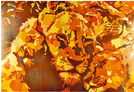
Kunstwerk in der Tiefgarage