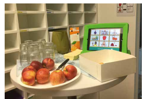
Pausenverpflegung – Znüni mittels UK bestellen