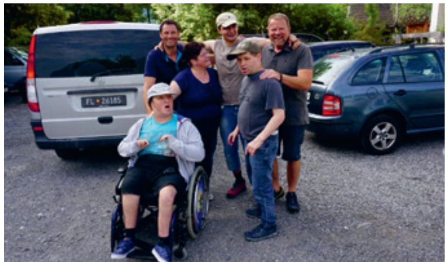
Ferien im Urlaubshof Scherer (Deggenhausertal, Deutschland)

Ferienteam, Wohnhaus Intensiv Betreuung (IB)