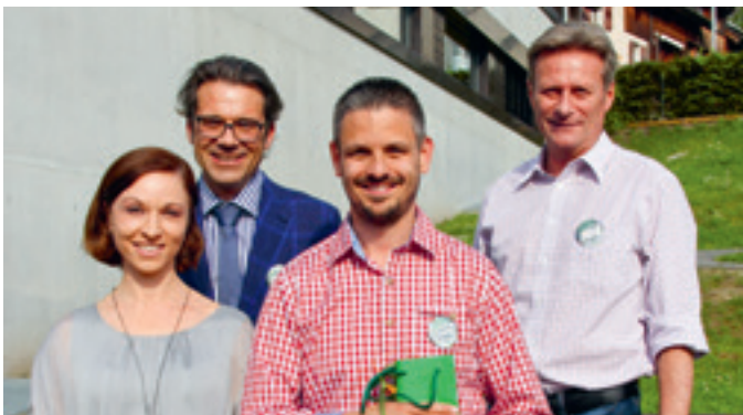
15 Jahre hpz