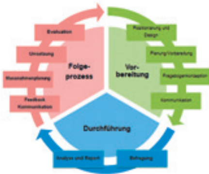
Ablauf einer Mitarbeiterbefragung

Chance «einer sinnvollen Tätigkeit» nachzugehen.