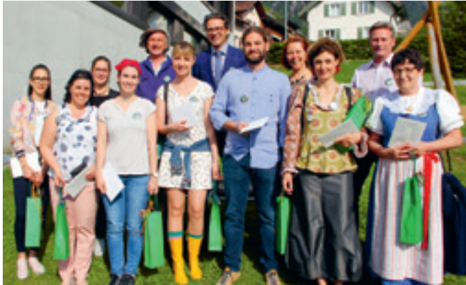
5 Jahre hpz