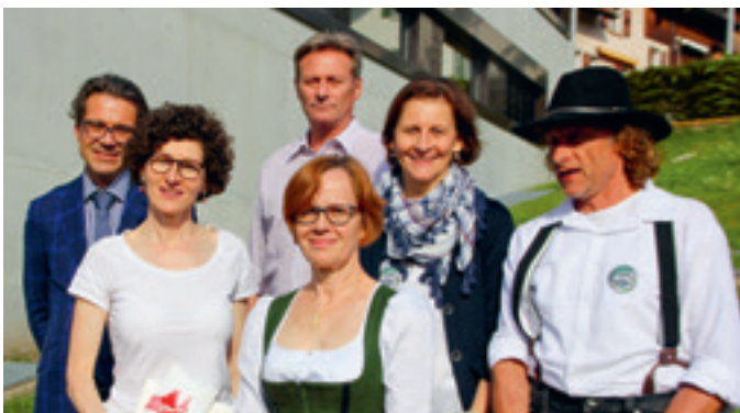
25 Jahre hpz