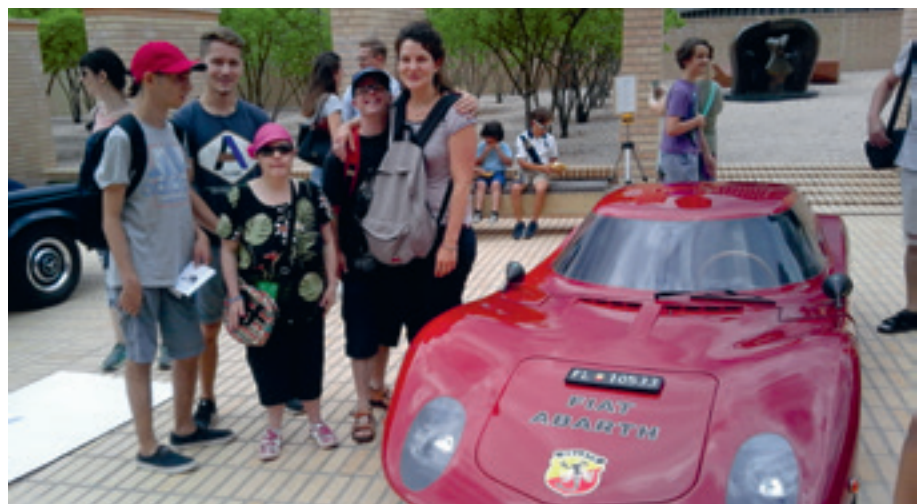
Der Fiat Abarath fand bei den Besuchern vom Birkahof grossen Anklang

Es war spannend zu sehen, was für eine Entwicklung in den letzten Jahrzehnten in der Automobilbranche stattgefunden hat und was alles berücksich-