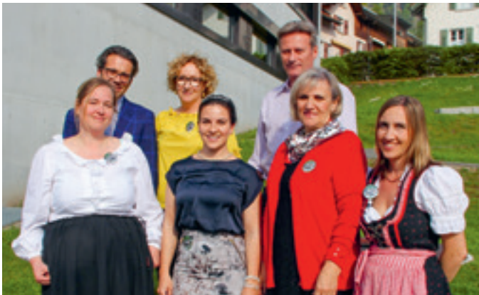
10 Jahre hpz