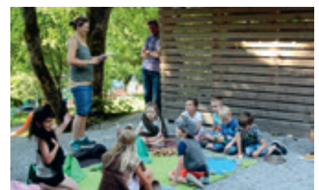
Theateraufführung vom Grüffelo