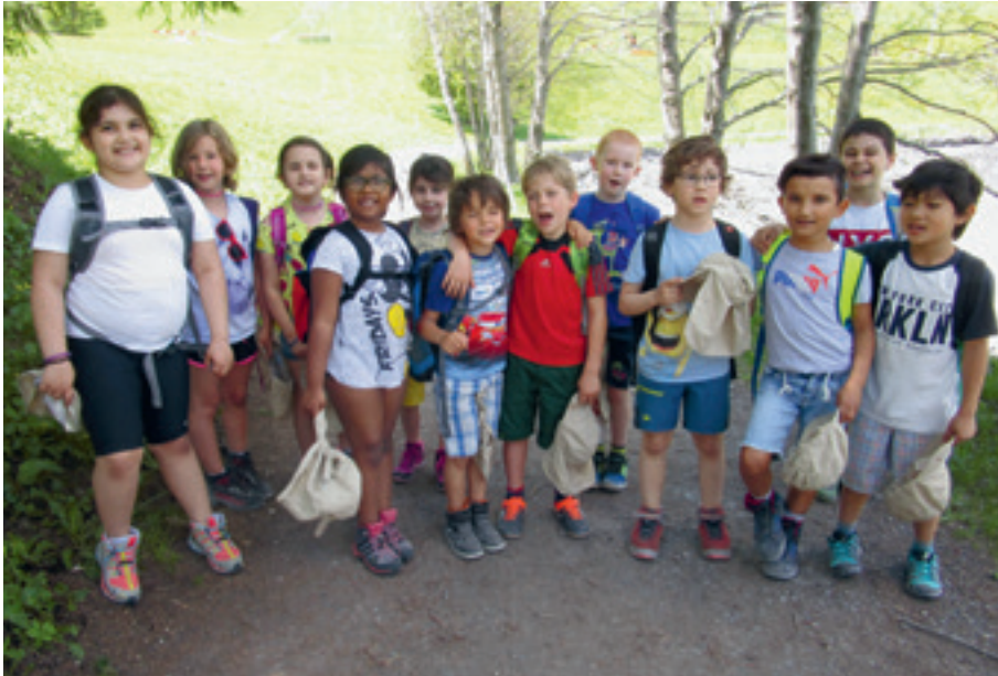
Wanderung um den Davoser See

Die Kinder der 1. Sprachförderklasse waren dieses Jahr vom 3. bis 7. Juni das erste Mal ins Klassenlager aufgebrochen und daher sehr gespannt, was sie in dieser Woche so alles erleben werden. Gut ausgerüstet und hochmotiviert fuhren wir am Montag zunächst bis nach Klosters auf einen tollen Spielplatz. Dort verspeisten wir die feine Z'Nüni-Jause, die unsere Küche für uns hergerichtet hat und spielten im Sandkasten oder kletterten auf die Rutschbahn.