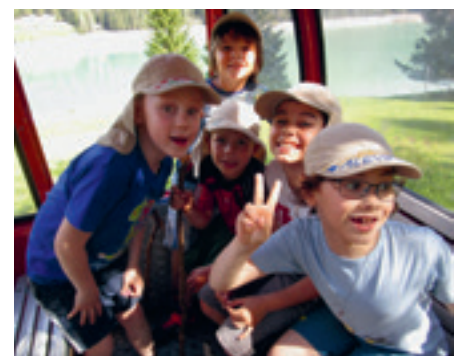
Auf dem Spielplatz