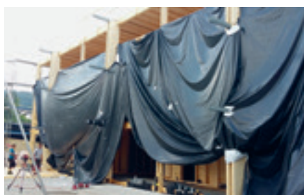
Das Holzgebäude stand bereits vor den wohlverdienten Sommerferien der Bauarbeiter