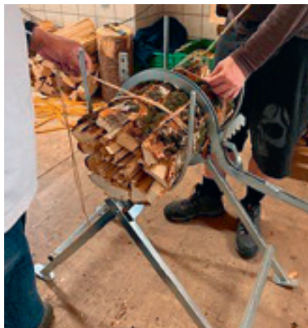
Herstellung von Holzbördele

Der Umbau hat uns zudem ermöglicht, mehr Gemüse anbauen und fachgerecht lagern zu können. Das grosse und vielfältige Angebot an Bio-Gemüse lockt immer mehr Kundinnen und Kunden an. Ob in unserem Hoflädile, auf den Märkten in Schaan, Balzers und Triesen oder bei unseren Grosskunden, denen wir Gemüse liefern. Aber nicht nur der Verkauf von Bio-Gemüse und Jungpflanzen, sondern auch der Verkauf und