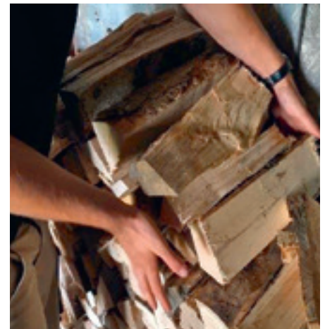
Verkauf von Brennholz

die Lieferung von Brennholz gestatten uns die Zusammenarbeit mit zahlreicher Kundschaft. Die vielen und wiederholten Bestellungen bestätigen, dass wir zuverlässig und vertrauenswürdig sind. Dies wäre ohne die partnerschaftliche Zusammenarbeit mit unserem Holzlieferanten nicht möglich.