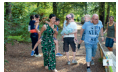
Huckepackwettbewerb mit den Eltern