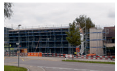
Im Herbst/Winter 2019 geht es an den Innenausbau und die Fassadengestaltung