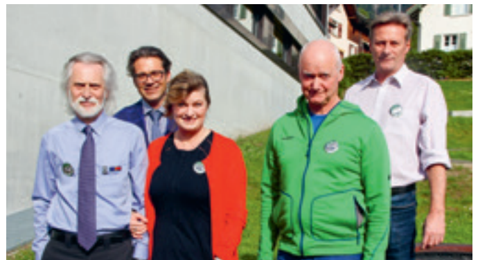
20 Jahre hpz