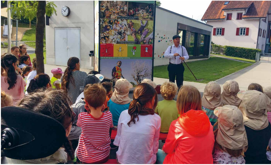
Thomas Beck auf Besuch im hpz

Der LED (Liechtensteinische Entwicklungsdienst) hat in diesem Jahr eine Wanderausstellung für die Schulen in Liechtenstein organisiert. Durch die Ausstellung sollen die Kinder auf die unterschiedlichen Kulturen und Lebensbedingungen in dieser Welt aufmerksam gemacht werden. Zum Auftakt des Projektes kam zu Beginn des Schuljahres der Schauspieler Thomas Beck als Reisender zu den Kindern in die Schule.