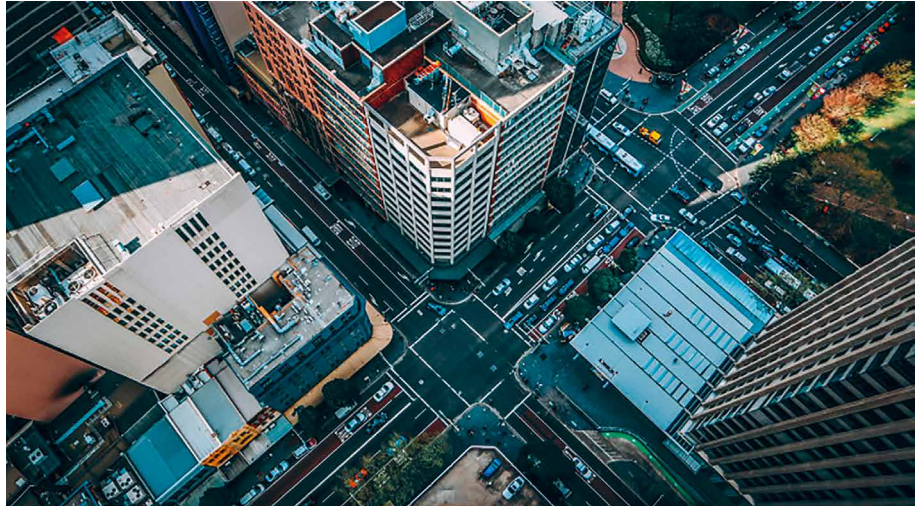
Die Strassenkreuzung als Metapher für das Konzept der Intersektionalität

In meinem Studium habe ich mich mit diesem Konzept besonders im dritten Semester auseinandergesetzt und finde es für die agogische Arbeit deshalb wichtig, da es versucht, soziale Ungleichheit in ihren verschiedenen in Wechselwirkung stehenden Kategorien und Dimensionen vereinfacht darzustellen. Denn Inklusion kann erst dadurch erreicht werden, indem Macht und soziale Ungleichheit in der Gesellschaft analysiert und verstanden wird. Intersektionalität unterscheidet zwischen vier Kategorien (Geschlecht, Herkunft, Klasse und Körper) und drei Ebenen (Struktur-, Symbol- und Subjektebene). Diese Kategorien und Ebenen stehen dabei in einer wechselseitigen Abhängigkeit (Interdependenz). Auf kategorialer Ebene kann daraus gefolgert werden, dass Menschen mit