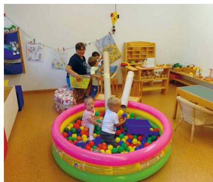
Erste Erfahrungen beim Spiel mit anderen Kinder ausserhalb der Familie

In der Heilpädagogischen Früherziehung nimmt die Beratung und Begleitung der Eltern einen wichtigen Stellenwert ein. Die Eltern haben ein Grundbedürfnis, sich über die Entwicklung ihres Kindes und die oft damit verbundenen Sorgen auszutauschen. Die Eltern-Kind-Treffen bieten eine Möglichkeit in ungezwungener Atmosphäre den Austausch, vor allem mit anderen Eltern zu pflegen, die ähnliche Fragen oder Erfahrungen gemacht haben. Das Treffen bietet bei Bedarf und Wunsch auch Gelegenheit, sich über spezifische Fachthemen zu informieren und diese zu diskutieren.