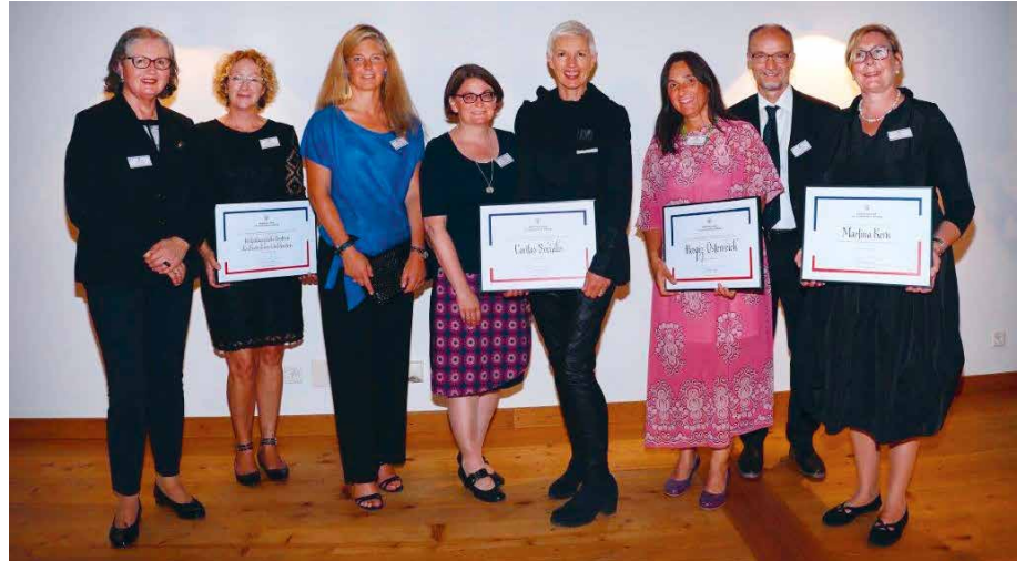
Preisverleihung der Fürst Franz Josef Stiftung