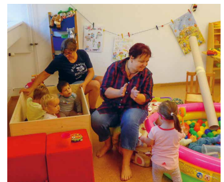
«Toll was es hier alles zu entdecken gibt!»