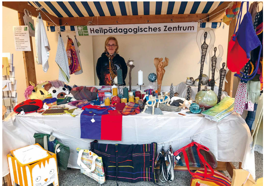
Stand beim Kunstmarkt 2018