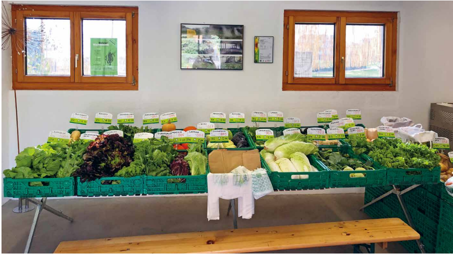
Das tägliche Angebot an frischem, saisonalen Gemüse

Im Innenhof des Areals der Agra in Mauren befindet sich in einer umfunktionierten Garage das Hoflädile. Dieses ist während des ganzen Jahres von Montag bis und mit Samstag, jeweils von 8 Uhr bis 20 Uhr geöffnet. Unter der Woche ist jeweils ein betreuter Mitarbeitender für die konstante Auffüllung des Gemüses während des Arbeitstages zuständig. Jeden Morgen wird das Hoflädile mit frischem saisonalem Gemüse aus den Kühlräumen bestückt und die Räumlichkeit gereinigt. Die meisten Kunden kommen zwischen 9 Uhr und 11 Uhr zum Einkaufen. Viele unserer betreuten Mitarbeitenden schätzen den di-