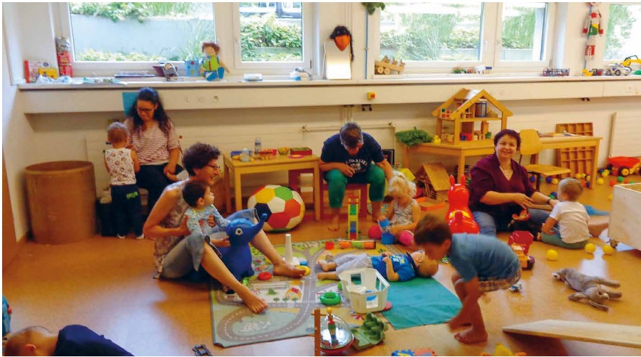
Zusammensein in vertrauter Atmosphäre

Nach einer erfolgreichen einjährigen Projektphase im 2017 wurde der Eltern-Kind-Treff (EKT) in der Abteilung Heilpädagogische Früherziehung als zusätzliches Angebot des hpz eingeführt. Das Treffen hat primär das Ziel, den Eltern eine Möglichkeit der Zusammenkunft und des Austausches zu bieten. Den Kindern soll das Treffen eine erste Erfahrung in einer kleinen, geführten Gruppe ermöglichen. Im Jahr 2017 durften wir die Eltern zu acht solchen Treffen einladen.