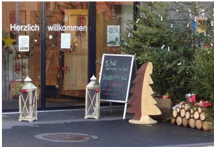
Weihnachtsstimmung im hpz Laden an der Steckergass 7, Schaan