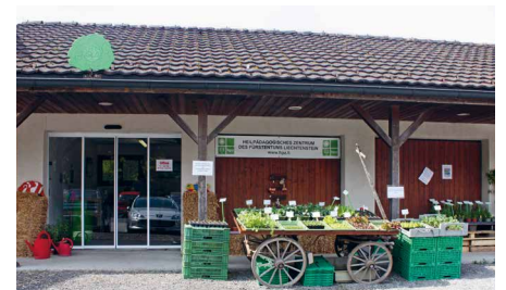
Hoflädile in der Agra, Mauren

Neben dem saisonalen Angebot an frischem Gemüse und Kräutern werden auch je nach Jahreszeit Setzlinge, Wärmepflanzen, Kräutertöpfe und Zierkürbisse verkauft. Ausserdem wird das vielfältige Angebot durch Produkte der Textrina, des Ateliers, der Servita, der Protekta sowie der Auxilia erweitert.