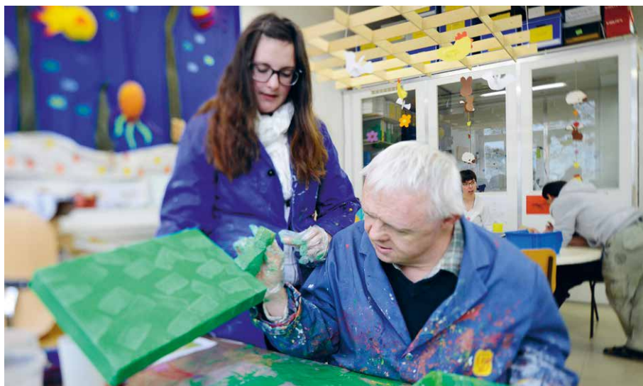
Betreuungsarbeit in der Protekta

*Ertrag aus Dienstleistungen und Verkauf eigener Produkte