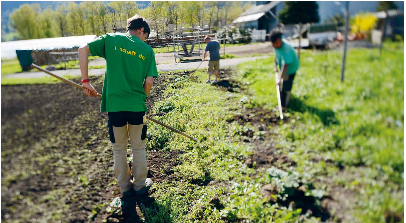
Pflanzenpflege in der Agra

Unser Angebot von geschützten Dauerarbeits- und Beschäftigungsplätzen im Bereich Werkstätten richtet sich an Menschen aus dem Fürstentum Liechtenstein und der Region Ostschweiz im erwerbsfähigen Alter, die eine liechtensteinische oder schweizerische Invalidenrente beziehen und eine der folgenden Behinderungsarten z.B. eine Entwicklungsverzögerung, eine kognitive Behinderung, eine psychische Beeinträchtigung oder eine Mobilitätsbehinderung aufweisen.