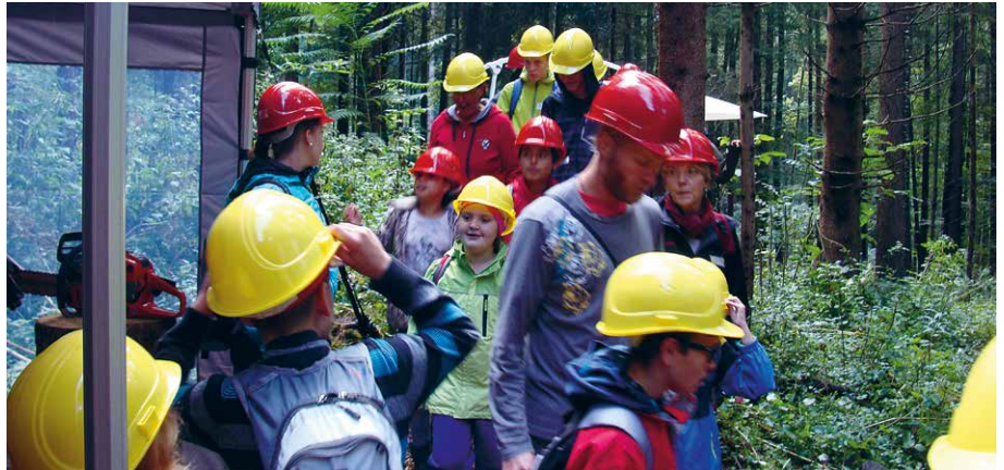
Waldtage in der Mittelstufe

Im Anschluss an die Basisstufe besuchen die Kinder und Jugendlichen die