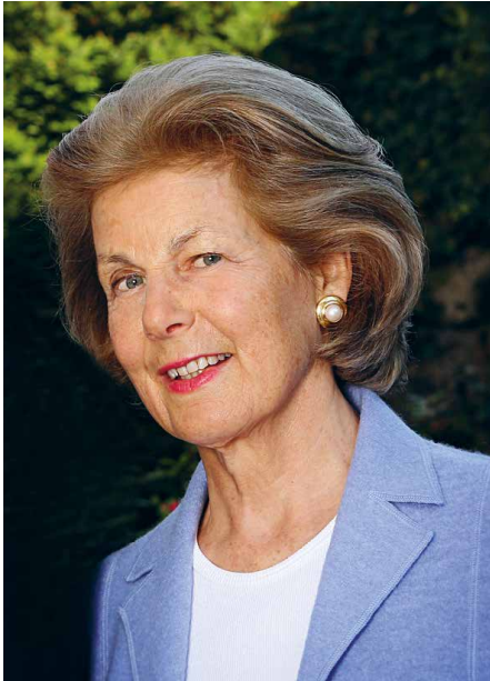
I.D. Fürstin Marie von und zu Liechtenstein