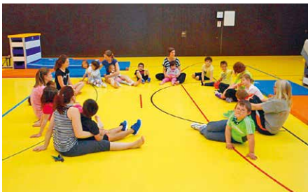
Basisstufe I und II

In der Sonderpädagogischen Schule gibt es die Basisstufe I und die Basisstufe II. In der Basisstufe I werden Kinder ab 4 Jahren gefördert. Die grosszügigen Räumlichkeiten bieten Platz für einen Bewegungsraum, einen Kindergartenraum mit verschiedenen Spielecken und einem Arbeits- und Ruheraum.