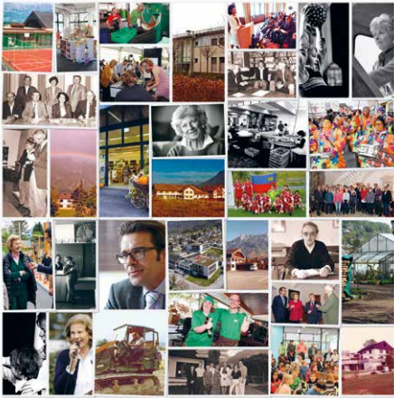
Titelbild: Collage 50 Jahre aus dem hpz