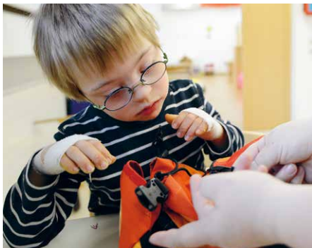
Arbeit in der Heilpädagogischen Früherziehung

Die Heilpädagogische Früherzieherin betreut Kinder in der Lebensspanne von Geburt bis Ende Kindergarten, welche in ihrer Entwicklung auffällig oder in dieser gefährdet sind. Diese Auffälligkeiten können sich sowohl in der geistigen, sprachlichen, motorischen, emotionalen, sozialen oder in der Wahrnehmungsentwicklung zeigen. Die Heilpädagogische Früherzieherin bietet diesen Kindern Förderung sowie deren Fa-