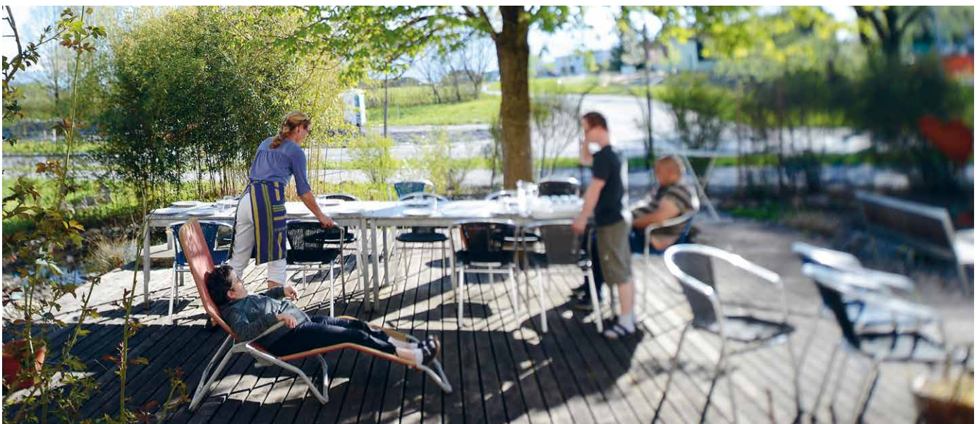
Impressionen aus dem Birkahof