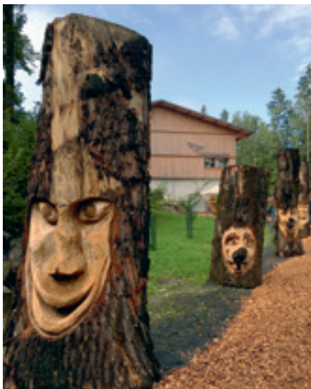
Der Weg zum Forstbetrieb.