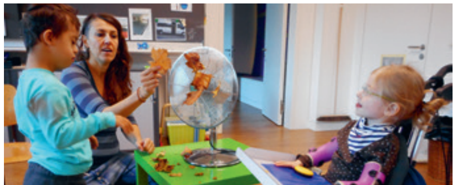
Erfahren von Ursache und Wirkung.