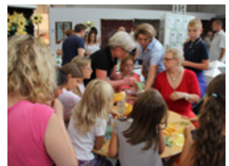
Reges Interesse am hpz-Stand.