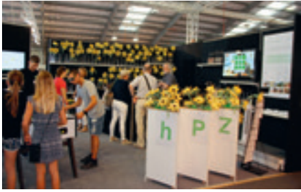
Der hpz Stand an der LIHGA 2016 zog viele Besucher/Innen an.