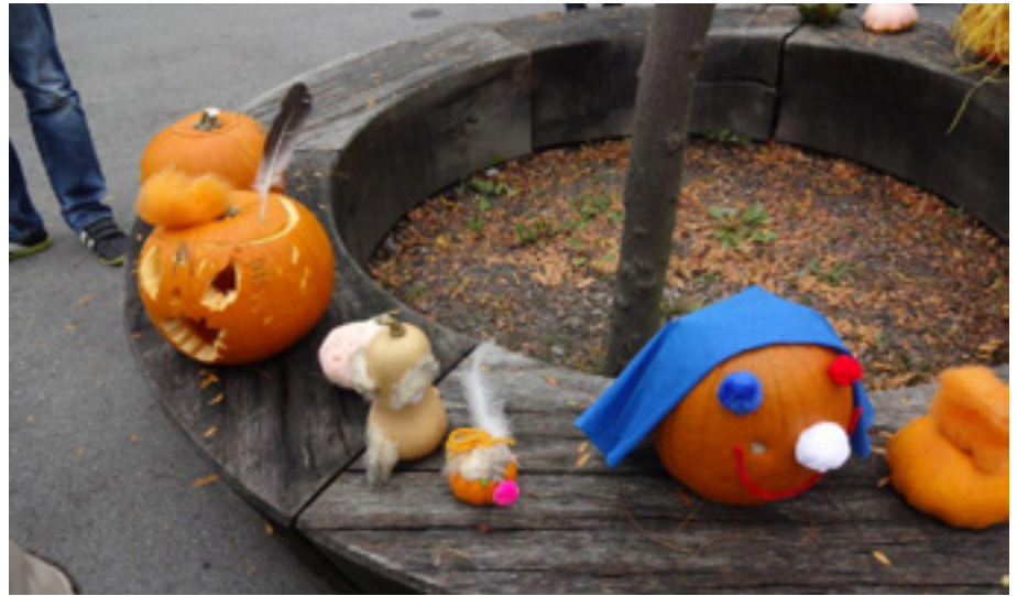
Die fertig geschnitzten Kunstwerke der Schulkinder.

Für das Mittagessen stand eine Kürbissuppe auf dem Menüplan. Dafür haben