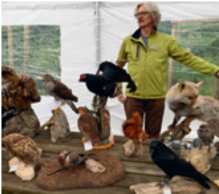
Tiere des Waldes.