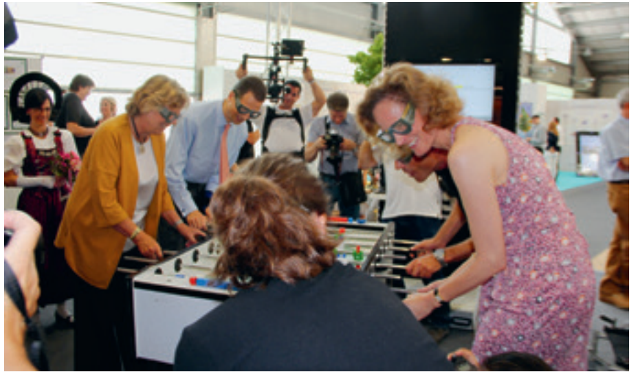
Das Erbprinzenpaar am hpz Stand.

Die Standgestaltung stand ganz im Zeichen von eigener Ressourcennutzung. Unter dem Einsatz vieler Kräfte wurde in eigener Regie geplant, hergestellt, aufgebaut, ausgestaltet und auch wieder abgebaut. Die bereichsübergreifende Zusammenarbeit von vielen Betei-