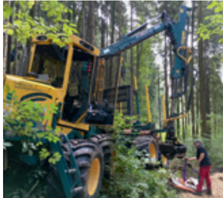
Bei der Holzernte.