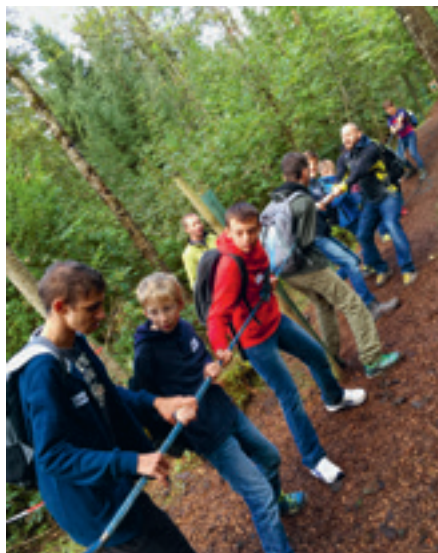
Kräfte messen am Seil.