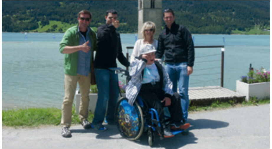
Das IB-Team genoss die unbeschwertten schönen Ferien.

Das Hotel weist unter anderem auf höhenverstellbare Waschbecken und rollstuhlgerechte Duschen hin. Welche