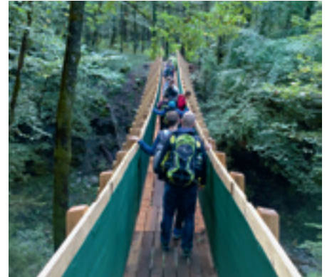
Hängebrücke aus Holz.

Die Liechtensteinischen Forstbetriebe veranstalteten in diesem Jahr wieder die «Waldtage». Diesmal fanden diese beim Forstwerkhof in Nendeln statt. Am Dienstag, den 20. September 2016, machten sich einige Klassen unserer Schule auf, um den Wald zu erkunden. Auf einem idyllischen Waldpfad erhielten die Schüler hautnah Einblicke in verschiedene Themenbereiche des Waldes. An sechs verschiedenen Stationen wurde Wissenswertes und Spannendes vorgestellt. Die Schüler lernten einiges über die Waldfunktion, die Holzernte, den Transport, die Holzprodukte und die Ökologie. Die einzelnen Posten wurden übersichtlich, informativ und interessant gestaltet. Die Förster vermittelten den Schü-