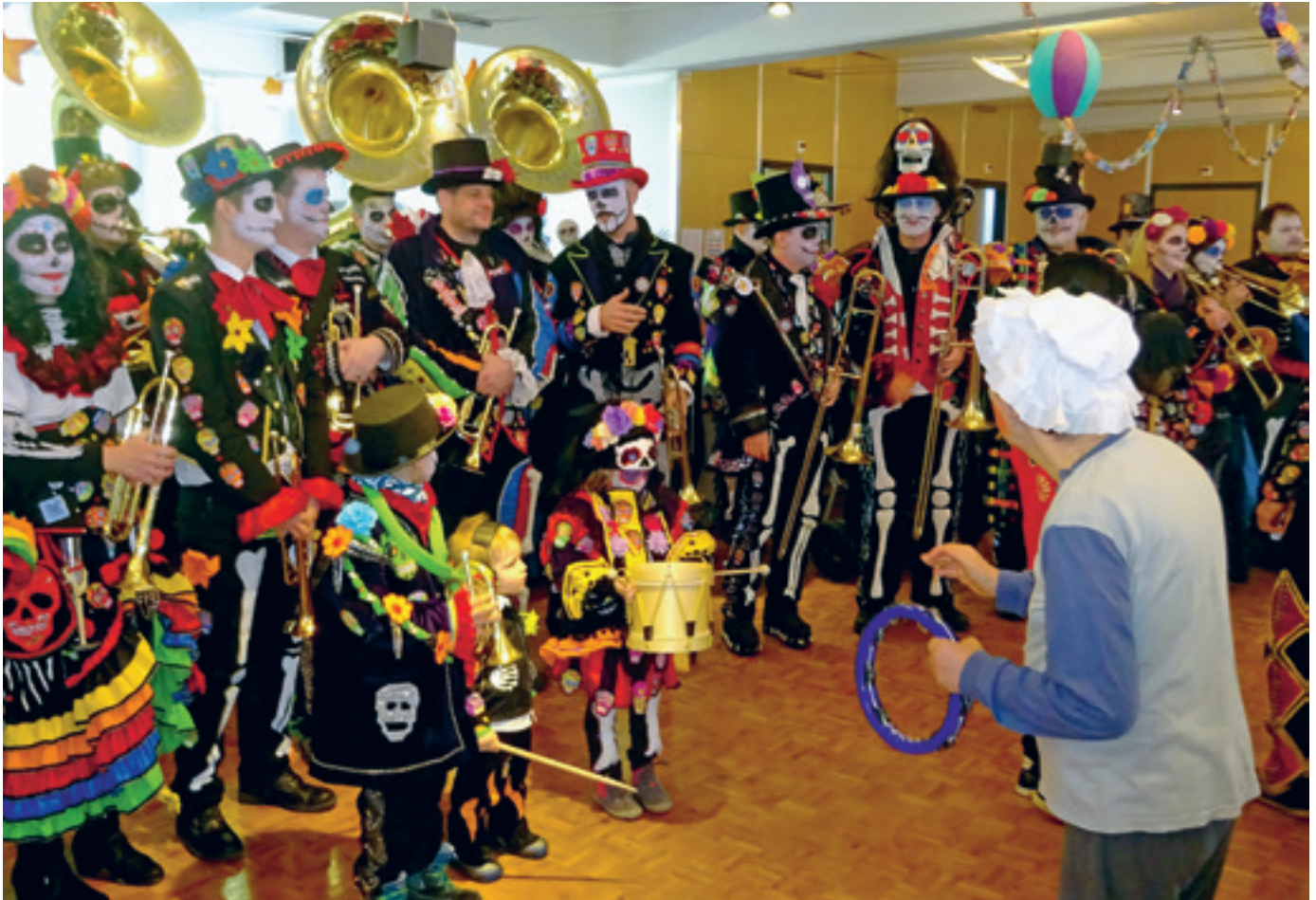
Die Guggamusik «Plunderhüsler» sorgten für gute Stimmung!

Das Fastnachtsfest ist in der Werkstatt traditionell ein wichtiger Höhepunkt im Jahreskreis und wird gemeinsam mit Fastnachtsfreunden aus anderen Abteilungen und den Wohnheimen entsprechend gefeiert. Am Freitagnachmittag, dem 5. Februar, haben wir unter dem Motto «Pyjamaparty» die Werkstatt zum Beben gebracht. Es wurde viel getanzt, gelacht und natürlich fein gegessen. Die Praktikanten und Prakti-