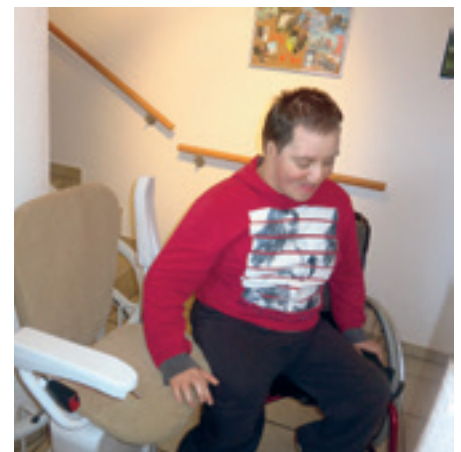
Behindertengerechte Einrichtung ermöglicht den Bewohnern die täglichen Aktivitäten möglichst selbstständig zu meistern.