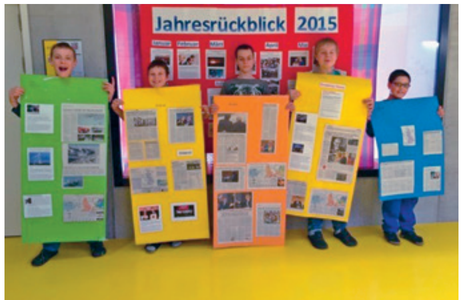
Informiert sein macht den Teilnehmer der News-Gruppe sichtlich Spass.