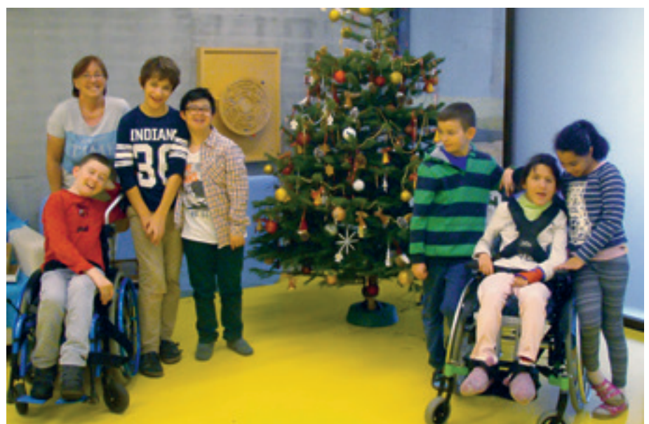
Diese Gruppe sorgt für Weihnachtsstimmung im Schulhaus.