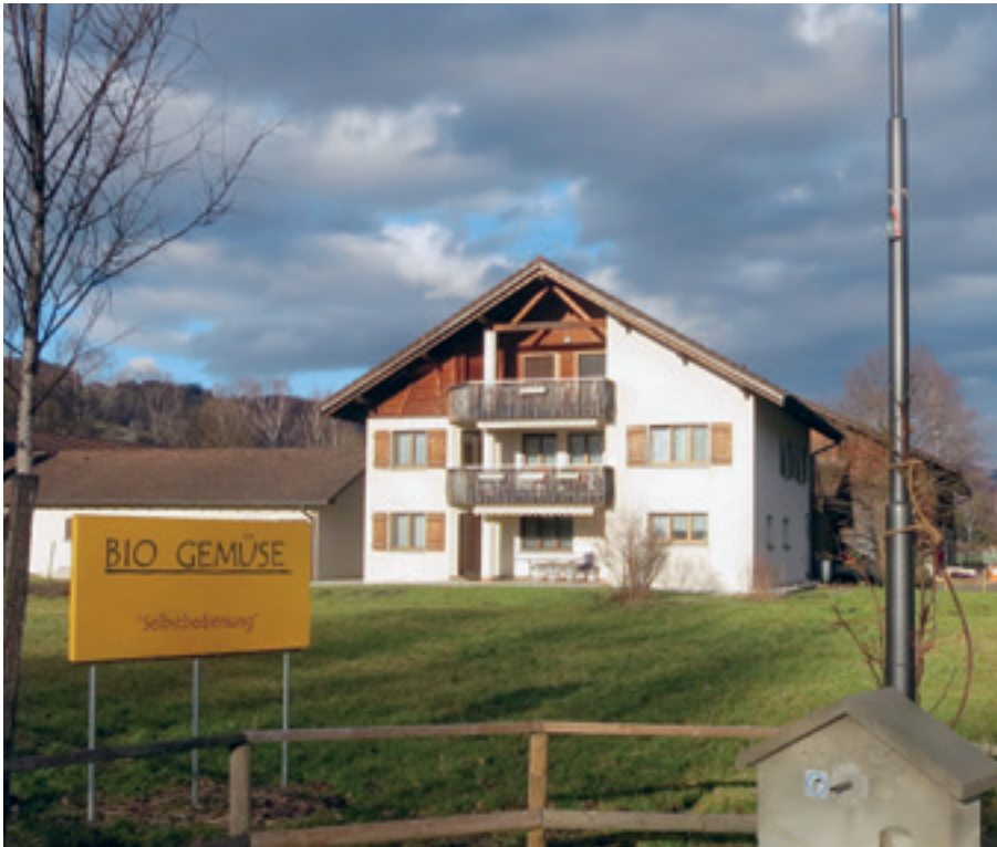
Die Abteilung Intensive Betreuung befindet sich in Mauren.