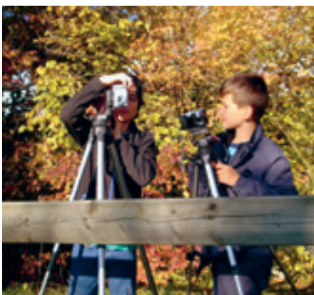
Schüler beim Filmen und Fotografieren.

Beim Fotokurs drehte sich alles um die Frage der Perspektive. Ob mittels Makroaufnahme oder gewählten Schärfeneinstellung, mittels Serienaufnahme