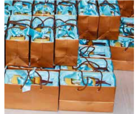
Die Taschen sind bereitgestellt.

den geschätzten Auftrag. Ebenso danken wir dem Marketing Communication Management der Bank für die gute Zusammenarbeit.