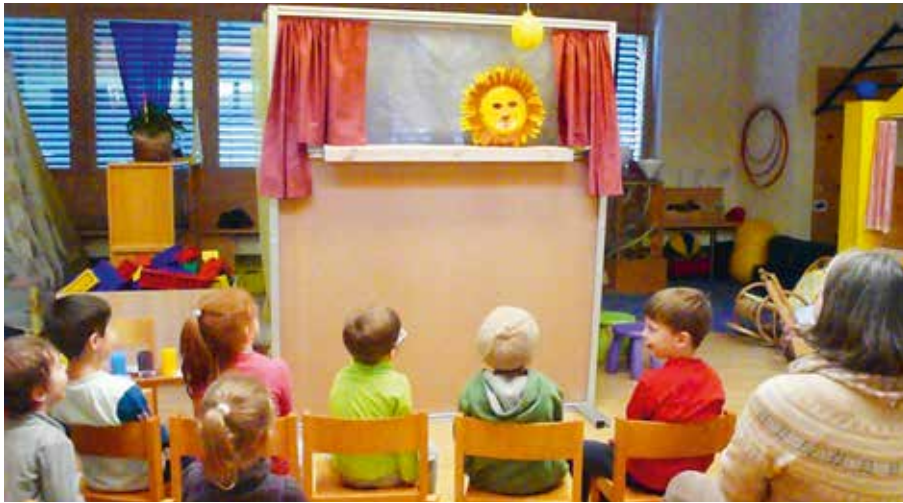
Die Kinder sind gespannt!