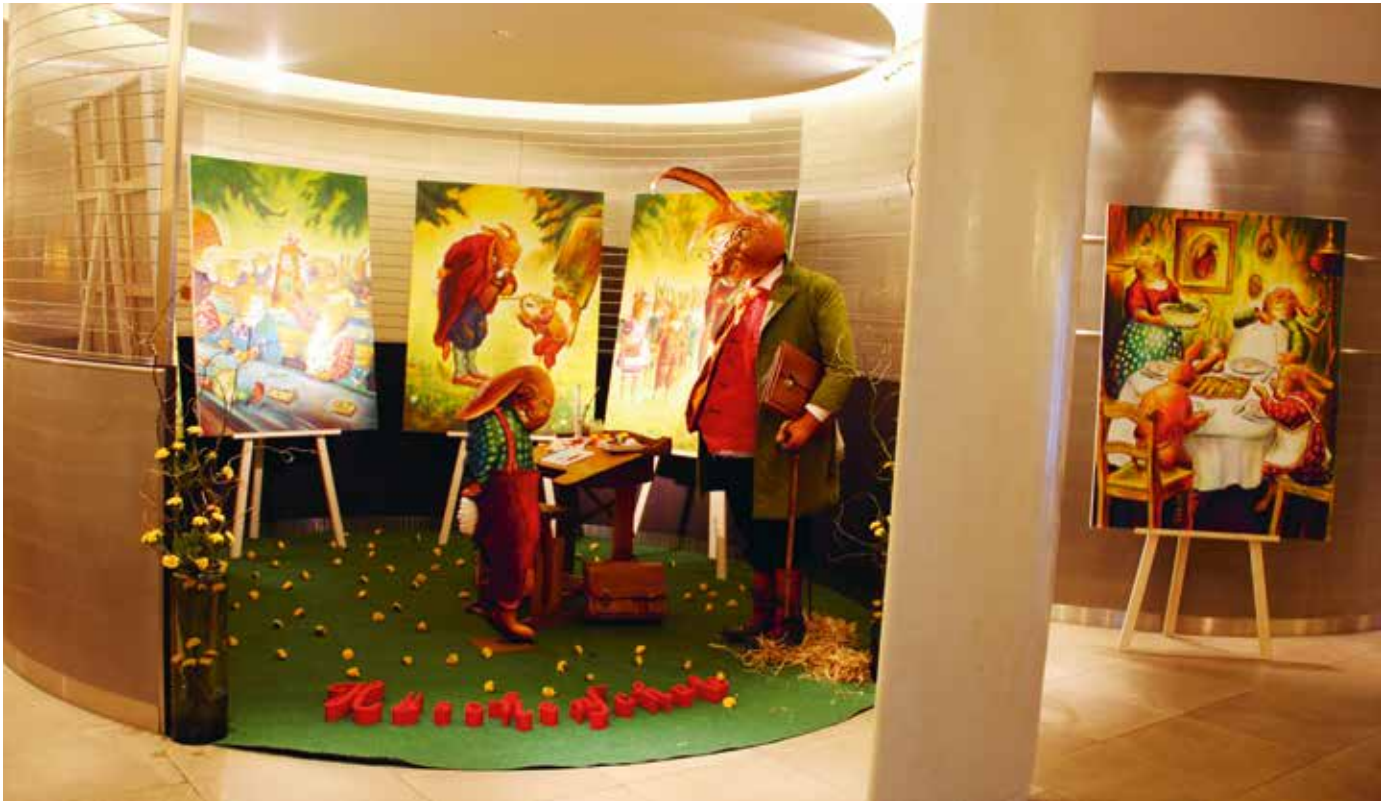
Ausstellung «Hasenschule» im Rondell der Schalterhalle der VP Bank.

In der letzten Ausgabe der Huuszitig berichteten wir von der geplanten österlichen Installation in der Kundenzone der VP Bank. Am 6. März war es dann so weit! Nach wochenlangen Vorbereitungen machte sich Lehrer Hase mit seiner Schülergruppe auf die Reise nach Vaduz. Das Rondell in der Schalterhalle verwandelte sich im Nu in ein Klassenzimmer alter Schule.