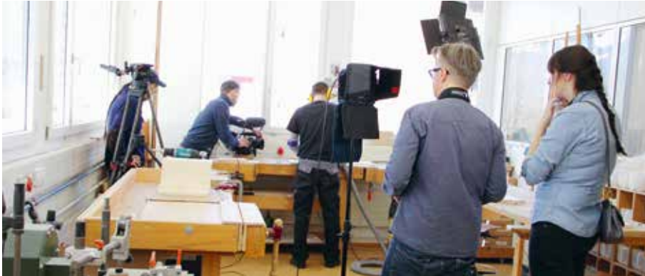
Dokumentation der Herstellung der Produkte durch ein Filmteam.