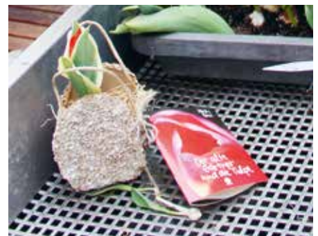
Die handgefertigten Frühlingstaschen.