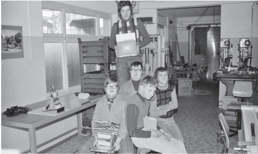
Ein Bild der 1. Stunde. In Vaduz, im St. Johanner fanden fünf Menschen mit einer Behinderung einen Arbeitsplatz.

Aus Anlass des 40-Jahr-Jubiläums vom Bereich Werkstätten stellen wir in den nächsten Hauszeitungen die verschiedenen Abteilungen der Werkstätten vor. Im Mai 1975 wurde die erste Werkstätte in einer provisorischen Unterkunft in Vaduz eröffnet. Fünf erwachsene Personen mit einer Behinderung fanden