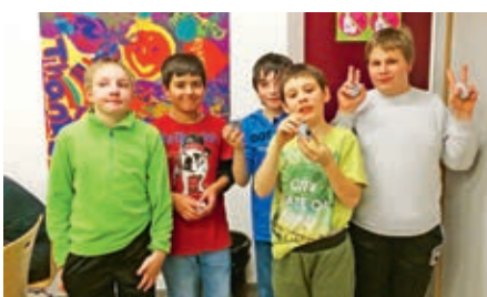
Schüler der Klasse von F. Pflieger.