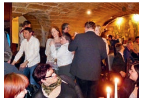
Auch wurde ausgiebig getanzt.

Wir machten einen Halt an einer Raststätte mit Verpflegung. Wir kamen ganz müde an und wurden mit einem leckeren z'Nacht im Hotel begrüsst. Dann war noch die Zimmereinteilung. Wir hatten die Nacht gut überstanden. Jeden Morgen gab es ein leckeres Frühstücksbuffet. Wir unternahmen eine Stadtrundfahrt und am Abend konnte man zu einem Fussball Match. Die anderen gingen ins Schwimmbad oder in den Zoo. Es hat allen sehr gut gefallen und wir konnten uns in der Gruppe sehr gut kennen lernen. Eine Teilnehmerin hatte während der Reise Geburtstag. Es gab am Abend eine Geburtstagsfeier. Wir konnten es uns richtig gut gehen lassen. Am anderen Tag gab es eine Schifffahrt auf der Elbe. Unseren letzten