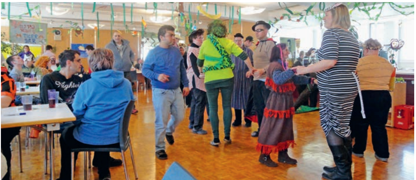
Die Mitarbeitenden genossen die Party und nutzten die Gelegenheit für Geselligkeit und Tanz.