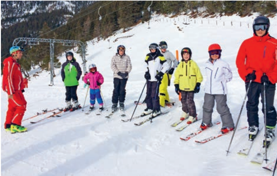
Skispass pur bei schönstem Wetter.