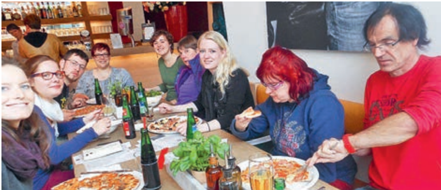
Da freuen sich alle auf die gute Pizza.