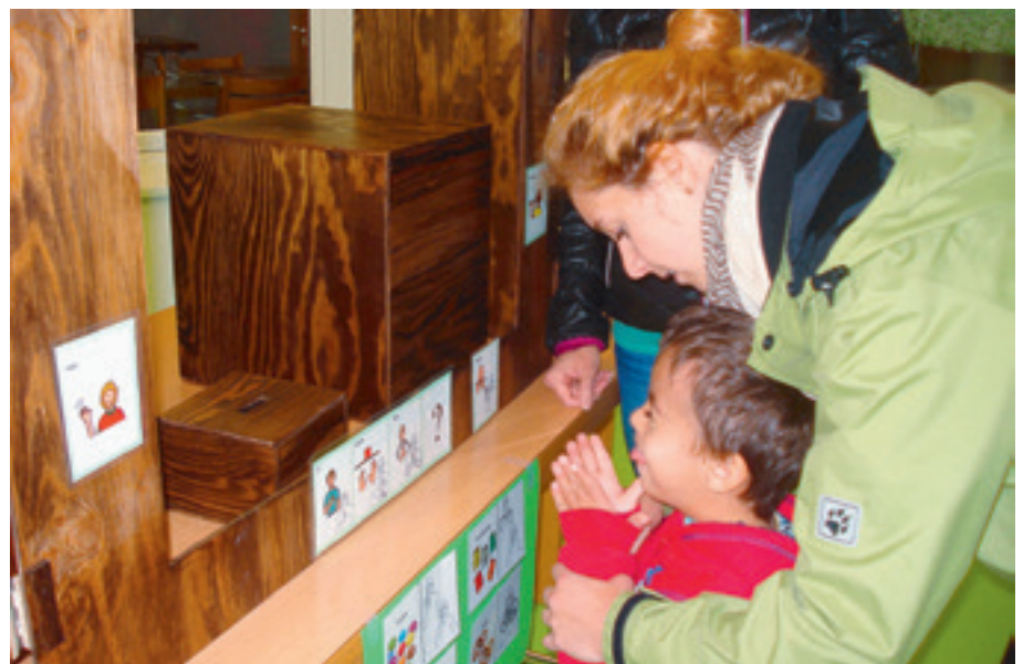
Diese Möglichkeit der Kommunikation unterstützt das Selbstbewusstsein der Kinder.