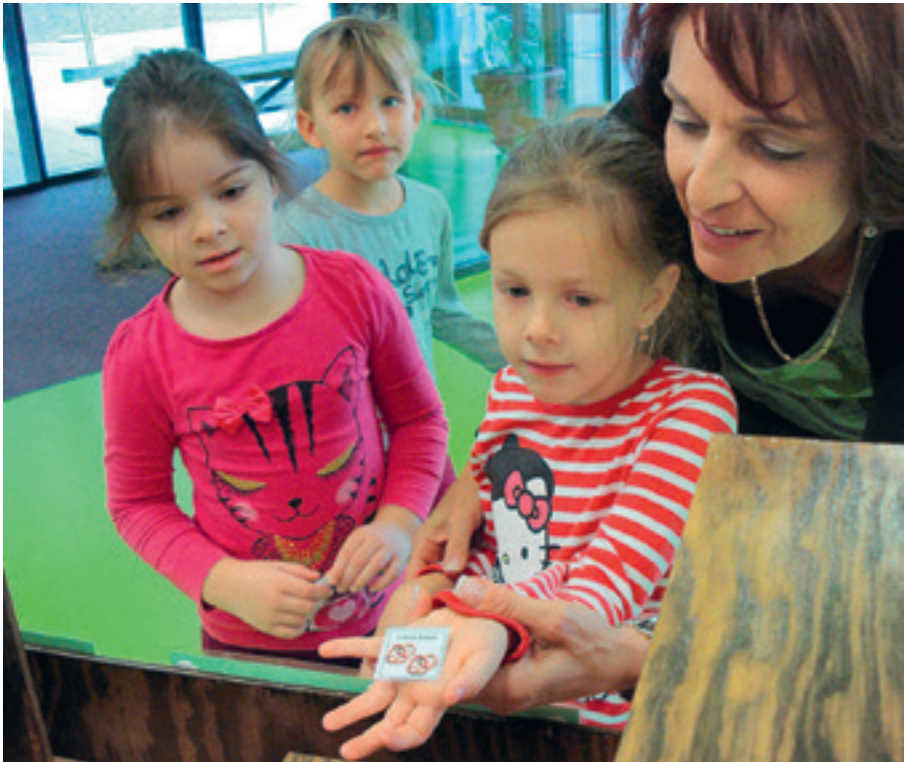
Ein Kind teilt mit, was es gerne haben möchte.

Heute, am 25. September 2014 wird der Tag der «Sprachen» begangen. An der Schule im hpz findet der Znünikiosk statt. Die Kinder freuen sich und stehen in einer Schlange vor dem Kiosk. Was ist heute wohl die Überraschung? Oder sind doch Smartis, Gummibärchen, Brezel oder Schokolade besser?