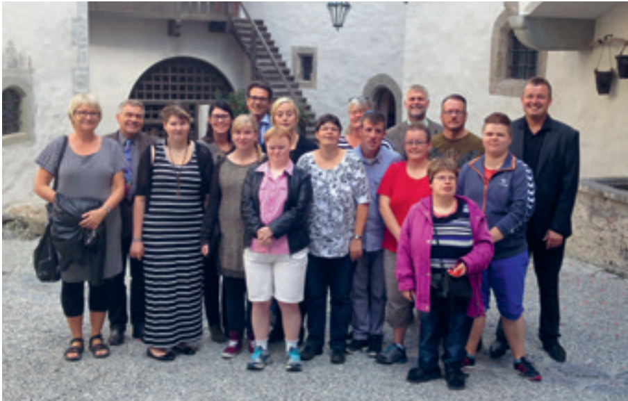
Erfolgreiches Austauschprojekt, Erfahrungen auf beiden Seiten!

Im September waren 15 Personen aus Dänemark im hpz zu Besuch. Dies war der Höhepunkt eines Austauschprojektes. Die Wilhelm Philipp Foundation hat den Zweck, Menschen mit Behinderung auf der Insel Bornholm zu unterstützen. Die Verantwortlichen der Foundation hatten vor einigen Jahren die Idee, dass neben der direkten Unterstützung auch der fachliche Austausch von Betreuerinnen sinnvoll sei und letztlich den Menschen mit Behinderung zu Gute kom-