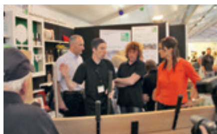
Regierungschef Adrian Hasler und seine Frau informieren sich über die vielfältige Produktpalette.