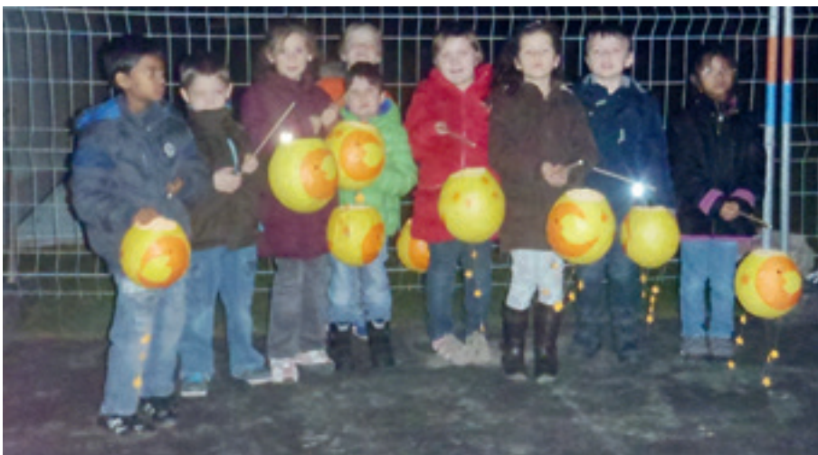
Die leuchtenden Laternen zaubern eine schöne Abendstimmung.

Endlich war es soweit. Das Laternenfest am 11.11.2014 wurde mit grosser Freude und Aufregung erwartet, denn wir