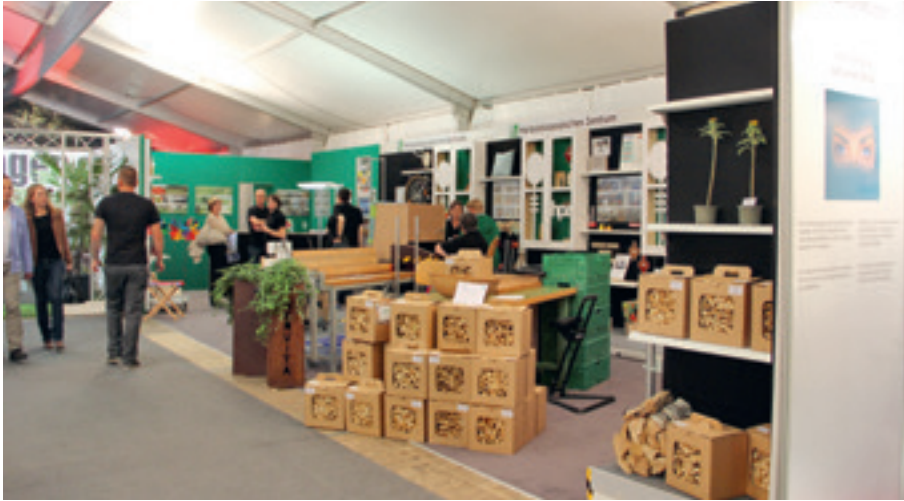
Der hpz-Stand an der Lihga 2014

Schon zum dritten Mal in Folge war das hpz an der Lihga vertreten. Diese Ausstellung ist eine optimale Plattform, um sich einer breiten Öffentlichkeit zu präsentieren, seinen Bekanntheitsgrad zu erhöhen und auf seine Anliegen aufmerksam zu machen. In diesem Jahr lag der Schwerpunkt darin, den Neubau Steckergass 7 vorzustellen und auf die anstehende Eröffnung hinzuweisen. Dies geschah mit Plakaten und der Ausstellung von vielfältigen Produkten aus den verschiedenen Abteilungen. Viele Sympathien und Anerkennung konnten die betreuten Mitarbeitenden gewinnen, die begeistert vor Ort an der Herstellung ihrer Produkte arbeiteten. Die Textrina war mit einem Nähtisch vertreten, an dem Säcklein aus selbst gewobenem Stoff genäht, dann mit duftenden Lavendelblüten gefüllt und den interessierten Besucher/innen als Ge-