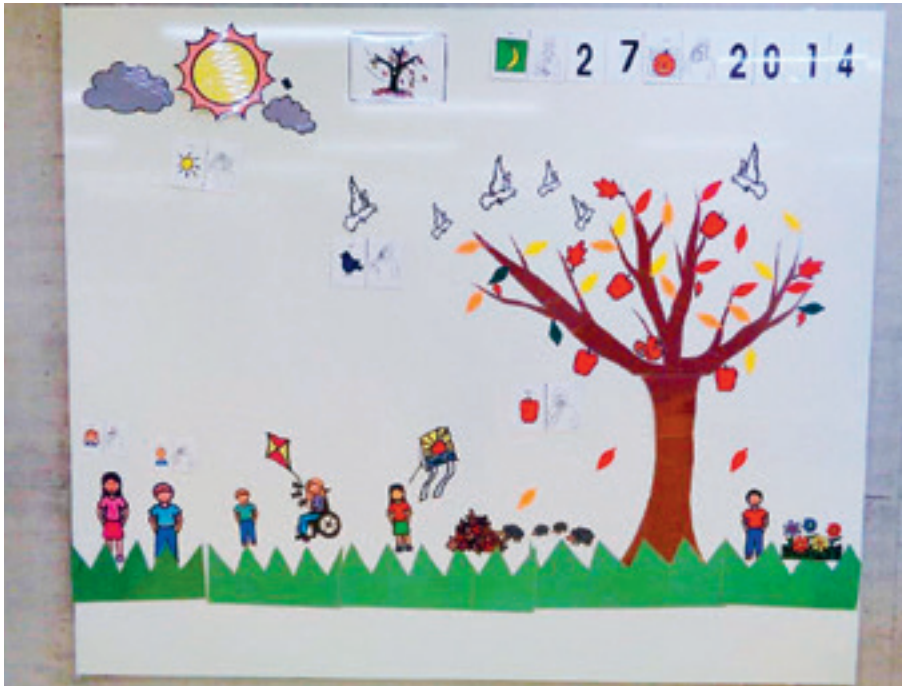
Neue Magnettafel im Foyer.