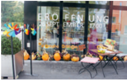
Eröffnung der neuen Räumlichkeiten der Werkstätten Atelier, Textrina und Servita