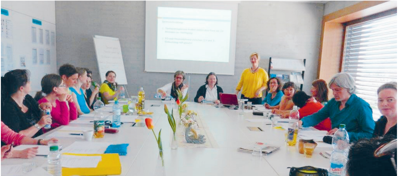
Das vollständige LogopädInnen-Team konnte an der Weiterbildung teilnehmen.

Eine fachliche Fortbildung und eine berufspolitische Veranstaltung im April und Mai dieses Jahres werden die liechtensteinischen LogopädInnen sicher noch lange in guter Erinnerung behalten.