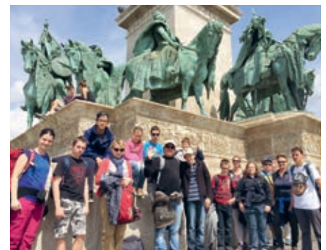
Die Schüler/innen nehmen viele Eindrücke mit nach Hause.