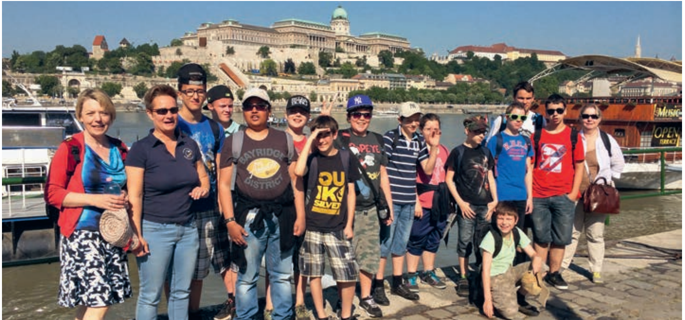
Die Reise in Ungarn war einzigartig, spannend und erlebnisreich.

Letztes Jahr im Herbst begeisterte uns das Konzert der ungarischen Band «Never give up». Im anschliessenden Austausch mit den Organisatorinnen wurde die Idee geboren, ein Klassenlager in Budapest abzuhalten.