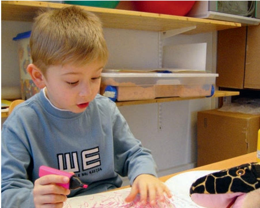
Stärken des Kindes unterstützen...