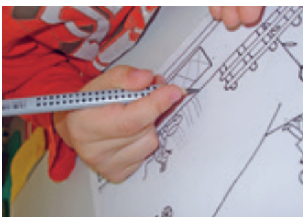
Beim Schreiben die Bleistiftspitze spüren