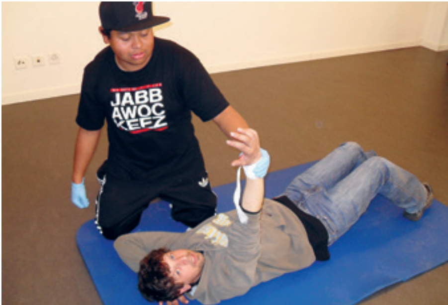
Ein fachgerechter Druckverband wird angelegt.

Das Angebot, einen freiwilligen Kurs mit dem Inhalt «Lebenserhaltende Massnahmen» zu besuchen, nahmen sieben Personen der Agra in Anspruch. Wir absolvierten an zwei Nachmittagen während je 2,5 Stunden den Kurs beim Samariterverein Unterland, der von Herrn