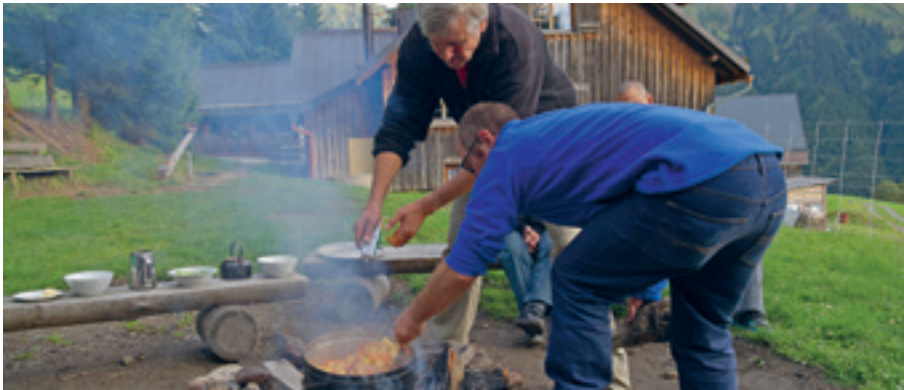
Ein gemütliches Lagerfeuer sorgt für gute Stimmung.

Im Herbst 2013 fuhren gemeinsam mit zwei Bussen ins nahegelegene Laternsertal. Die Hütte Marienruh war für die nächsten drei Tage unser Zuhause. Nach dem Bezug der Zimmer ging's auch schon los. Das Programm war vielfältig gestaltet, um allen Interessen gerecht zu werden. Es wurden Gipsmasken angefertigt. Zum Gestalten der Masken sammelten wir gemeinsam im nahegelegenen Wald Naturmaterialien,