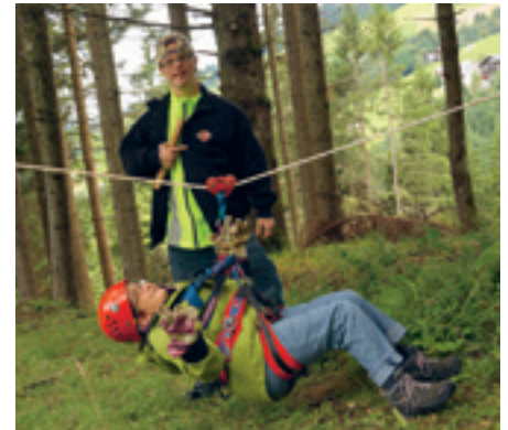
Die Slackline machte den Teilnehmenden sichtlich Spass.

mit denen die Masken kunstvoll verziert wurden. Ein Highlight der Outdoortage war die gespannte Slackline, die von allen Bewohner/innen bewältigt wurde. Als Ausgleich zu den Outdooraktivitäten wurden genügend Ruhezeiten, Spaziergänge und Pausen geboten. Auch für das leibliche Wohl wurde ausreichend gesorgt. Es gab gute Jausen für zwischendurch und am Abend ein gemeinsames Kochen am Lagerfeuer. Die