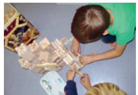
Gemeinsam Lösungen finden