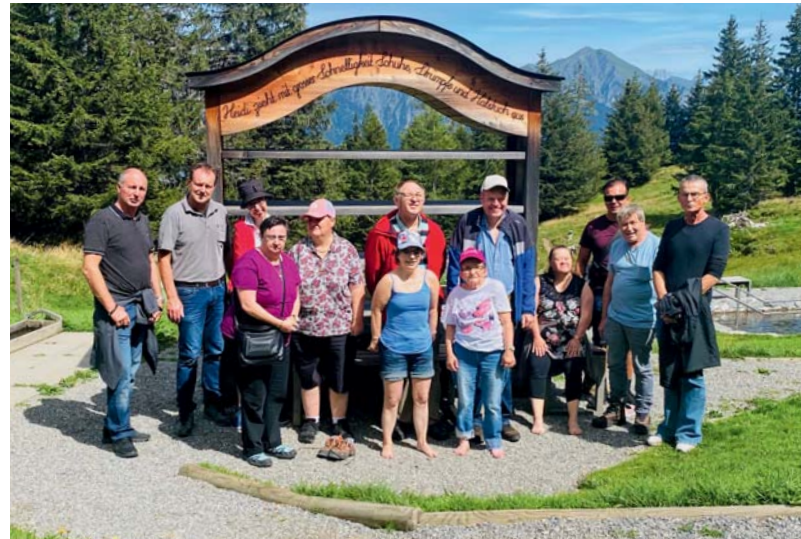
Gute Stimmung beim Jubilaren- ausflug zum Pizol.

Am 25. August 2020 lud der Vereinsvorstand zum alljährlichen Jubilaren-Ausflug ein. Elf Jubilare folgten der Einladung. Der Ausflug führte zum Pizol, wo wir mit den Jubilaren den Heidipfad besuchten. Nach einem kurzen Fussmarsch haben wir uns am Rastplatz ausgeruht und einige der Teilnehmenden haben sich ein Kneippbad gegönnt, andere haben sich am Erlebnisbarfusspfad verweilt. Nach dem Rückmarsch gab es im Restaurant einen verdienten Zvieri bevor es wieder Richtung Heimat ging. Wir hoffen, dass es allen Jubilaren gefallen hat und wir freuen uns heute schon auf den Ausflug im Jahr 2021.