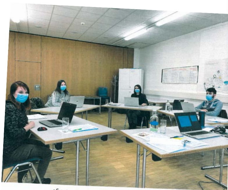
Notebooks im Einsatz - eine grosse Freude

Lieber Vereinsvorstand Wir bedanken uns bei Ihnen für die gespendeten Notebooks. Mit grossem Vergnügen nutzten wir die Notebooks bei unserem Workshop heute zum ersten Mal. Sie erleichtern uns das Arbeiten, was uns sehr motiviert. Mit Freude schreiben wir jetzt unsere Arbeitsdokumentationen und Projekte. Vielen Dank und herzliche Grüsse Ausbildene Fachperson Betreuung