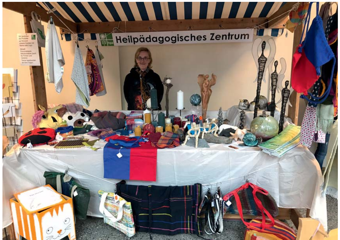
hpz-Stand im Kunsthandwerkmarkt im SAL in Schaan.

Auch wir vom Verein waren an diesem Stand präsent und konnten neben zahlreichen interessanten Begegnungen und Gesprächen bei dieser Gelegenheit 43 neue Vereinsmitglieder gewinnen.