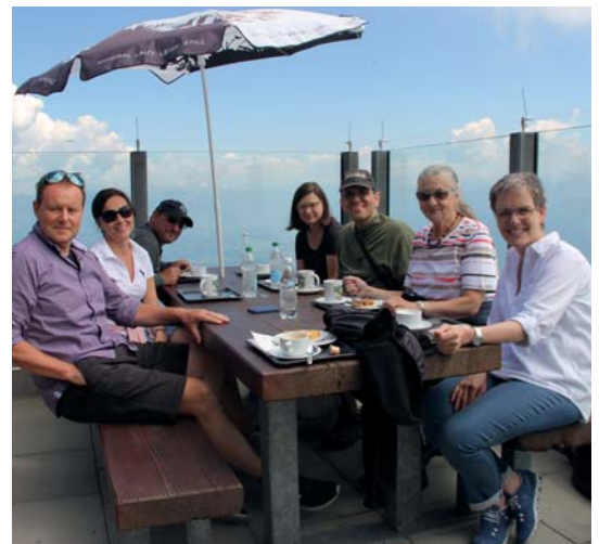
...und unternahmen zusammen mit den Vorstand einen wunderbaren Ausflug auf den «Hohen Kasten».